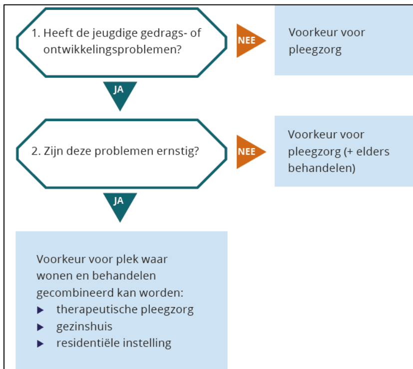
Figuur 3 Beslismodel voor inzet type hulp bij uithuisplaatsing (Bartelink et al., 2017, p. 41)

gehanteerd, waarin eerst wordt gezien of het meest ‘gewoon gezinsachtige’ plaatsingsmilieu – een pleeggezin – een goede en haalbare optie is (zie figuur 3).