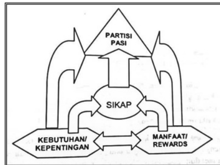
Gambar 3. Faktor-Faktor yang Berpengaruh terhadap Tumbuh-Kembangnya Partisipasi