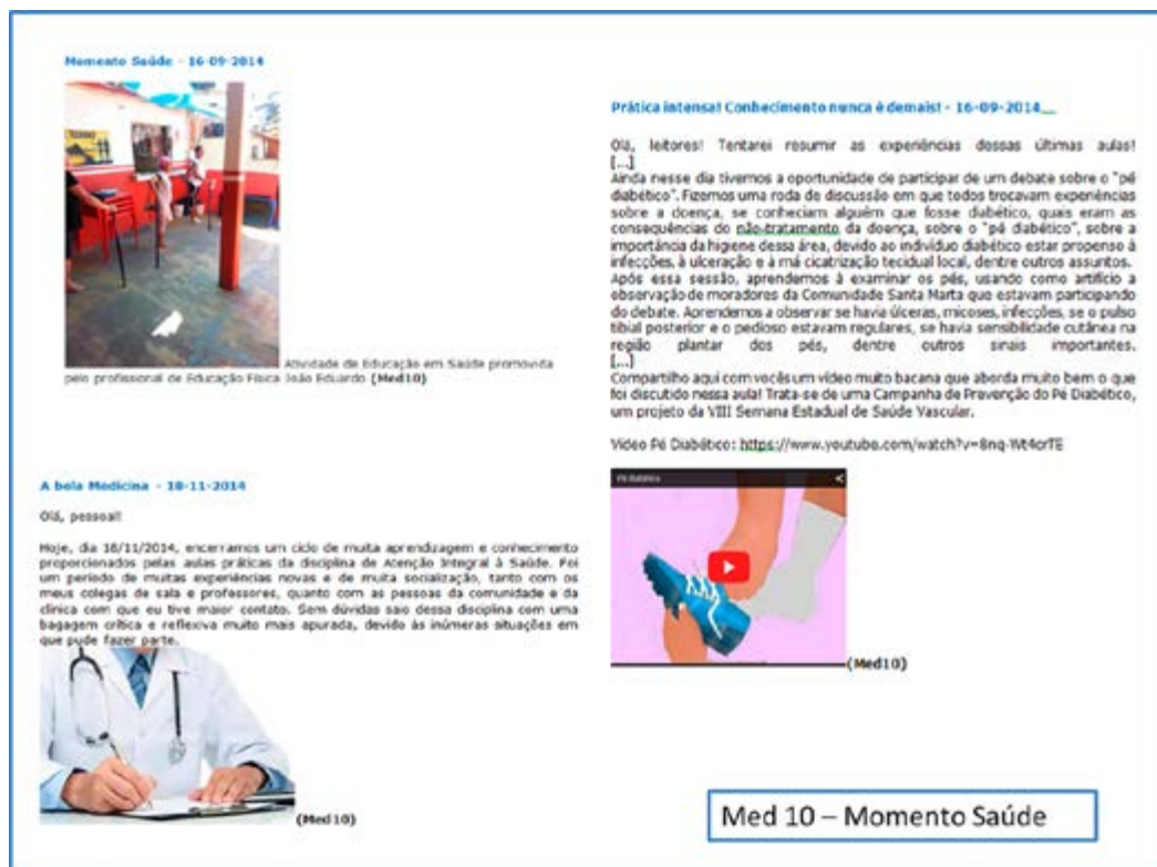
Figura 1: Exemplos de narrativas digitais com os três tipos de configuração de mídia.

O blog do aluno Med10, denominado “Momento Saúde”, apresentou 22 narrativas digitais. Quanto ao tipo de mídia/linguagem, utilizou texto, imagens/fotos e vídeos; em relação à configuração da mídia, construiu narrativas dos três tipos: conteúdo de mídia individual; conteúdo de mídia múltipla e narrativa em multimídia. As narrativas com conteúdo de mídia individual eram compostas não apenas por textos; algumas apresentavam somente imagens/fotos. Aquelas que apresentaram conteúdo de mídia múltipla continham texto e imagem/foto, mas esta última não estava interligada ao sentido da narrativa. As demais se constituíram como narrativas em multimídia e foram produzidas a partir de texto e imagens/fotos ou texto e vídeos. A Figura 1 ilustra exemplos dos três tipos de configuração de mídia utilizados por Med10.