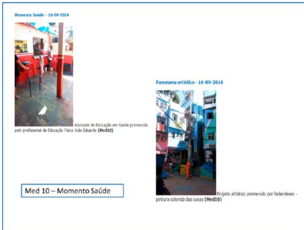
Figura 3: Exemplos de narrativas de conteúdo de mídia individual contendo imagens/fotos.

Os resultados encontrados demonstram o uso de diferentes linguagens na produção das narrativas, principalmente as imagens/fotos e os vídeos, e as três configurações descritas por Paul (2012), com destaque para as narrativas em multimídia. Isso corrobora outros estudos que também utilizaram essa perspectiva de análise. No trabalho de Bissolotti, Gonçalves & Pereira (2015) no qual se analisou um hiperlivro, foram identificados dois tipos de configuração, narrativa em multimídia e conteúdo de mídia múltipla; em relação ao tipo de mídia, havia a presença de texto, imagem, vídeo e animação. Os autores também reconheceram que, pelo tipo de produção do estudo, não foi possível analisar as narrativas a partir de todos os elementos propostos por Paul (2012). No entanto, essa taxonomia apresentada pela autora não se limita ao seu contexto de construção, em ambientes online , podendo ser adaptada em outras produções. A narrativa digital representa, portanto, um novo tipo de abordagem que alcança a sua própria forma de expressão, principalmente pelas possibilidades oferecidas pelas tecnologias digitais (Bissolotti, Gonçalves & Pereira, 2015).