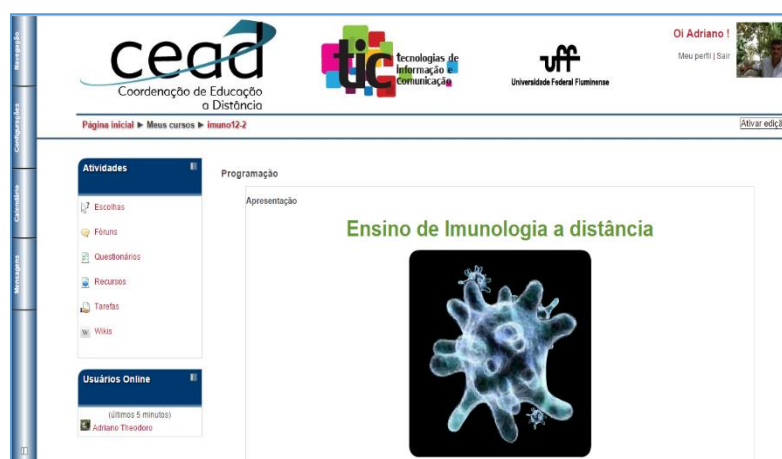
Figura 2. Página de Apresentação do AVA criado na plataforma Moodle.

O programa selecionado para criar o AVA foi o Modular Object Oriented Distance Learning (Moodle), um sistema de gerenciamento de aprendizagem que facilita a implementação de cursos a distância (Moodle, 2015). O programa é baseado na pedagogia socioconstrutivista e trata a aprendizagem como atividade social por meio de trabalho colaborativo em ambiente online (Figura 2). Criado em 2001 por Martin Dougiamas é distribuído gratuitamente sob licença General Public License (License, 2007).