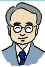
Illustration by K