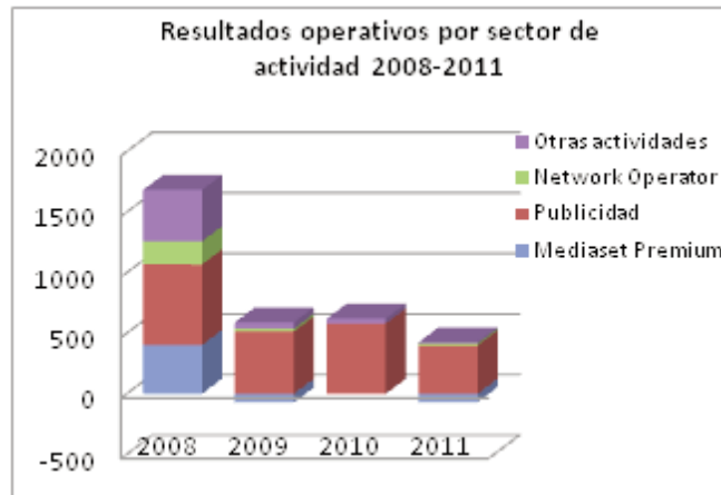
Figura 2. Resultados operativos por sector de actividad 2008-2011.

La “Figura 2” muestra la evolución del resultado económico por sectores de actividad desde el 2008 al 2011, puesto que Mediaset Italia decide a partir de 2012 integrar estos datos en uno solo que denomina actividad televisiva integrada. Bajo esta etiqueta engloba los datos sobre publicidad, producción y distribución web, televenta, etc. Sin embargo, sí hace una mención aparte con Le Towers, sociedad italiana resultado de la fusión y combinación de servicios dedicados a la gestión de infraestructuras de telecomunicaciones y radiodifusión. La inclusión de Le Towers ha jugado a favor del grupo italiano al aumentar su volumen de ingresos.