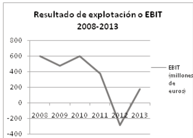
Figura 1. Resultado de Explotación o EBIT 2008-2013.

En la “Figura 1” se observa un gran desplome del resultado económico de Mediaset Italia a partir del 2010 que toca fondo en el 2012 con un resultado negativo de -284 millones de euros. Esto significa que en este año, el volumen de costes del grupo de comunicación italiano superó al de ingresos. Se evidencian así los efectos de la crisis económica que contrajo el mercado publicitario, hiriendo de gravedad a los grupos de comunicación, entre ellos Mediaset Italia. Sin embargo, el 2013 vislumbra una recuperación volviendo a situar a la empresa en datos positivos. No se alcanzan los datos de 2008 con un resultado de explotación de 597.7 millones de euros, pero puede suponer una nueva tendencia al alza.