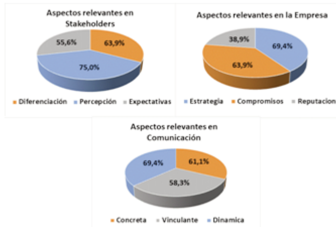
Figura 1. Listado de artículos seleccionados.

Para el elemento “Empresa” los tres aspectos con mayor relevancia según su recurrencia fueron: la “Estrategia” con un 69.4%, los “Compromisos” con un 63.9% y la “Reputación” con un 38.9%. (Ver Figura 1).