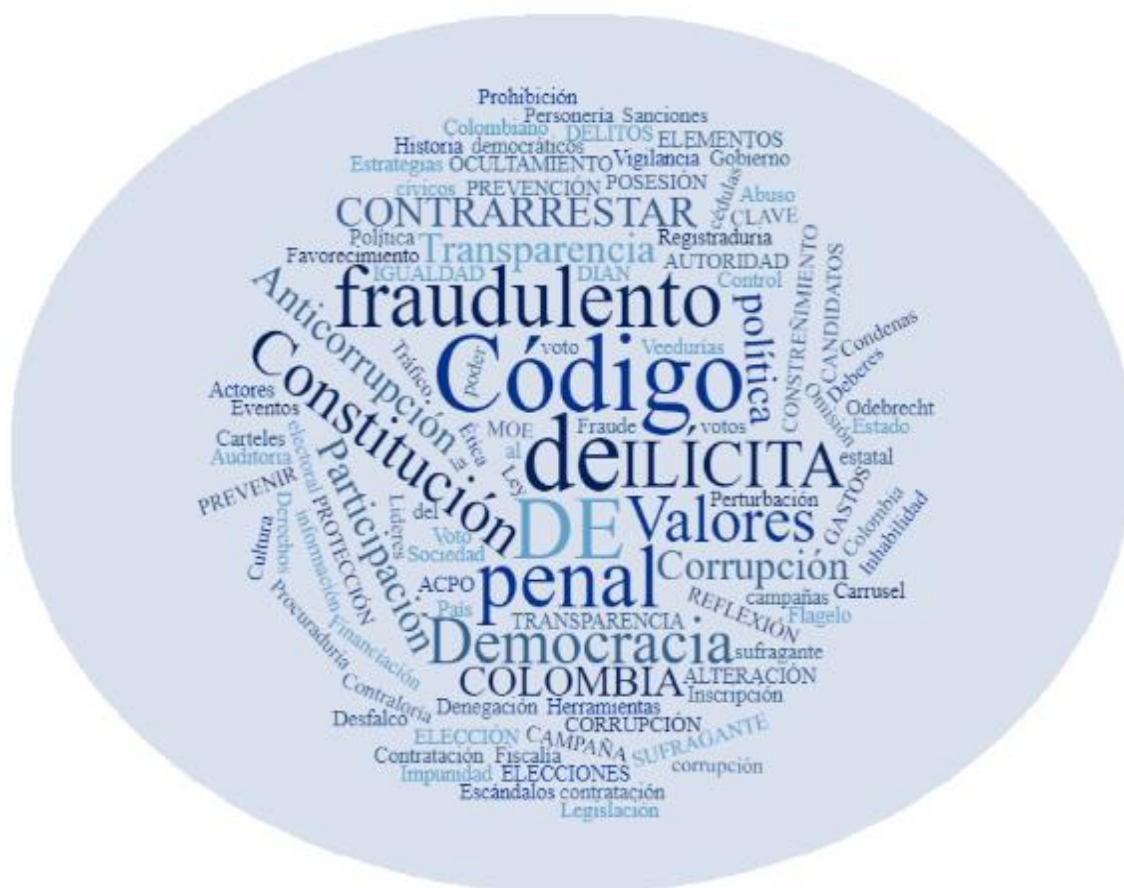
Figura 1. Nube de palabras

respuesta de esta normatividad se pretende endurecer las penas ejecutoriadas con lo referente a las condenas de los delitos electorales teniendo presente ejemplaridad que hagan de éstos temerle los probables corruptos que pretendan cometer esta clase de actos delincuenciales (Cordoba, 2016).