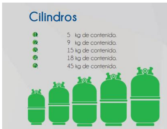
Figura 1. Tamaños de cilindros que se comercializan en Colombia

Cuando existe una cantidad razonable de datos históricos, siendo este caso las ventas realizadas de las referencias de cilindros autorizadas en el territorio colombiano que señala la figura 1 de los 3 depósitos o puntos de ventas surtidos desde la planta envasadora de GLP, la proyección para el futuro de toda esta información puede ser una manera efectiva de realizar previsiones a corto plazo (teniendo en cuenta la participación de cada referencia en el mercado), la cual sirve como entrada para procesos internos de una organización como producción, aprovisionamiento, alistamiento, compras y distribución.