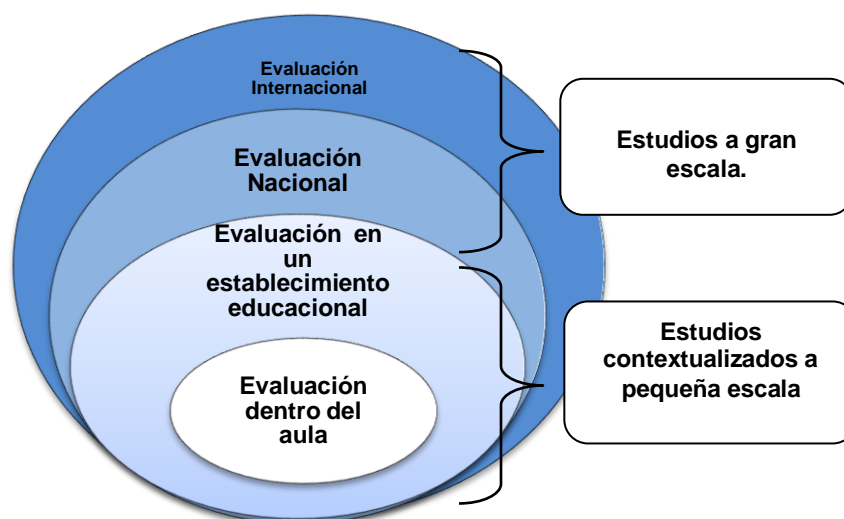
Figura de elaboración propia.