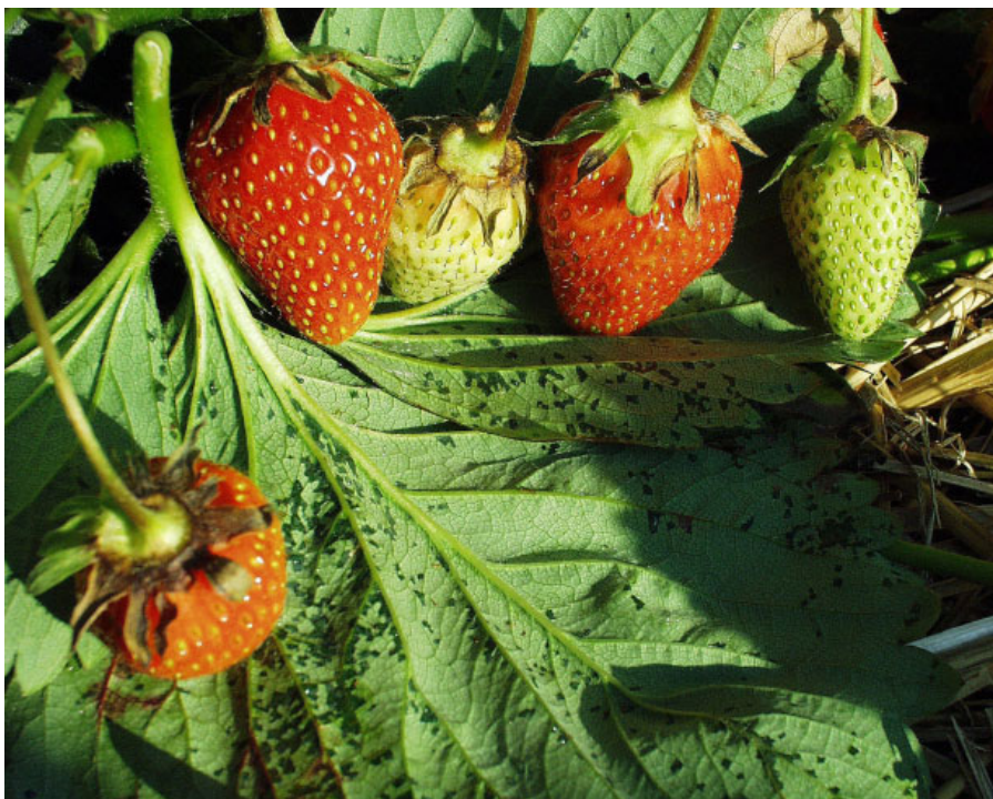
Angrep av Xanthomonas fragariae på blad og begerblad