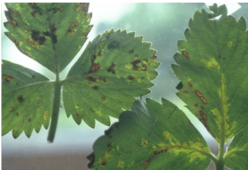
Gjennomskinnelige bladflekker etter angrep av Xanthomonas fragariae