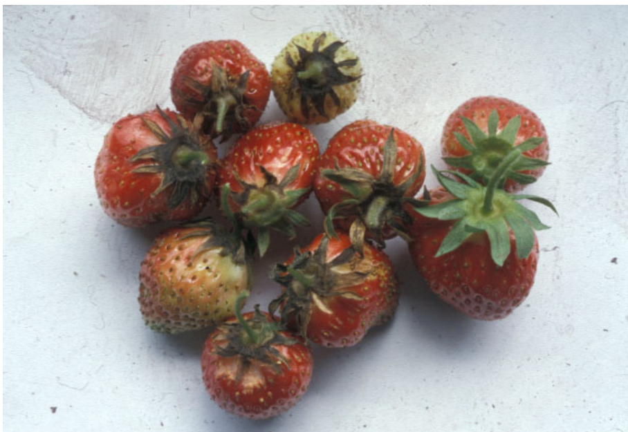
Angrep av Xanthomonas fragariae på begerblad