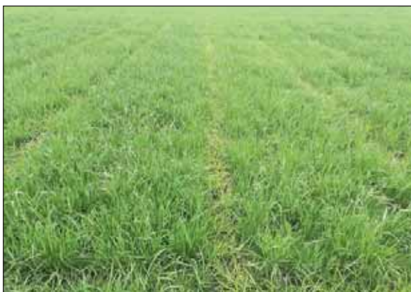
Bilde 1. Fargeforskjeller i bladverket hos engsvingelplantene på ruter gjødslet med 15 kg N/daa (til venstre) og 9 kg N/daa (til høyre) i forsøksfeltet på Landvik 18. mai 2017, fire dager før feltet ble vekstregulert.

På grunn av at ulike N-mengder ble benyttet i 2014 og 2015 (6, 9 og 12 kg N/daa) og i 2016 og 2017 (9, 12 og 15 kg N/daa), er det i den felles statistiske behandlingen for alle fire år kun tatt med ledd med felles N-mengde (9 og 12 kg N/daa).