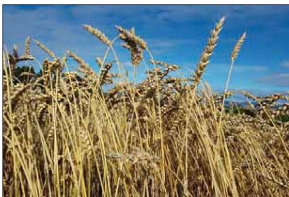
Bilde 2. Mirakel strekker seg mye etter skyting.

Trimaxx og Medax Max brukt ved BBCH 31-32 har gitt relativt liten forkorting av strået i alle feltene. Samme dose av Trimaxx brukt ved BBCH 35 har gitt