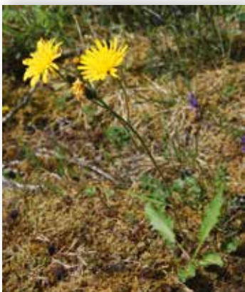
Beitesvæve. Foto: © B. Bele/NIBIO.