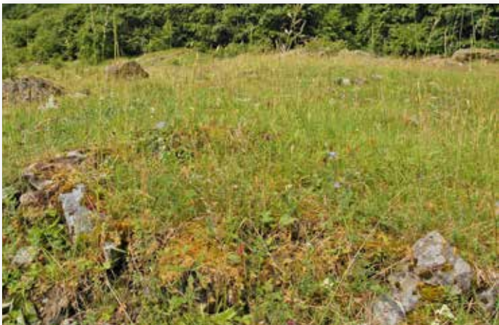
Tørrbakkane og knausane er ofte sterkt prega av beite.

Mange tørrbakkar, knausar og kantsoner er verdifulle leveområde for planteartar som er i tilbakegang. Aktuelle tiltak for å ta vare på dei er rydding av busker og tre som skuggar ut den karakteristiske floraen og helst tradisjonell skjøtsel.