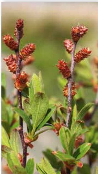
Purpurraude horaklar under bløminga om våren.