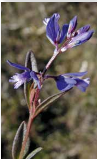
Heiblåfjør: Foto: @ K. Vignander.

Begge artane er vanlege i kyststroka i heile regionen. Storblåfjør går også inn i fjordane. Heiblåfjør veks opp til 900 moh. i Fusa.