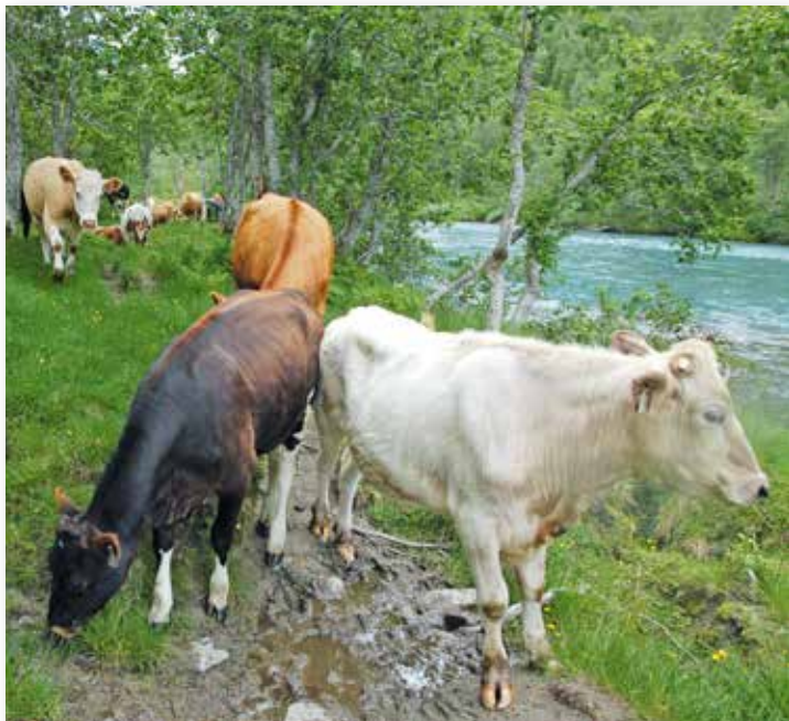
Skogsvegetasjonen vert beita sterkast langs buføringsveggar og stiar.

Beiteskogen er oftast meir artsrik enn tilsvarande skog som ikkje vert beita. Mange artar er avhengig av dei ljosopne tilhøva som beitinga medfører og forsvinn når skogen blir tettare. Utmarksbruken har gått sterkt attende i seinare tid, det gjer at beiteskogen i dag vert vurdert som ein nær trua naturtype. Å halde oppe skogsbeitinga også i tida framover, har svært mykje å seie for det biologiske mangfaldet vårt.