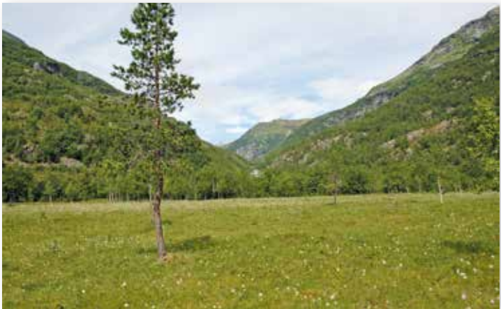
Semi-naturleg myr (slåtte- og beitemyr) ved Dulsete, Mørkridsdalen.

Slått er den beste skjøtselen av dei gamle slåttemyrene. I starten vil det truleg vere naudsynt å slå kvart år, men sidan kan ein slå frå kvart tredje til kvart tiande år. Høyet bør fjernast (så sant ein ikkje berre ynskjer å hindre krattoppslag). Beitemyrer bør framleis bli beita.