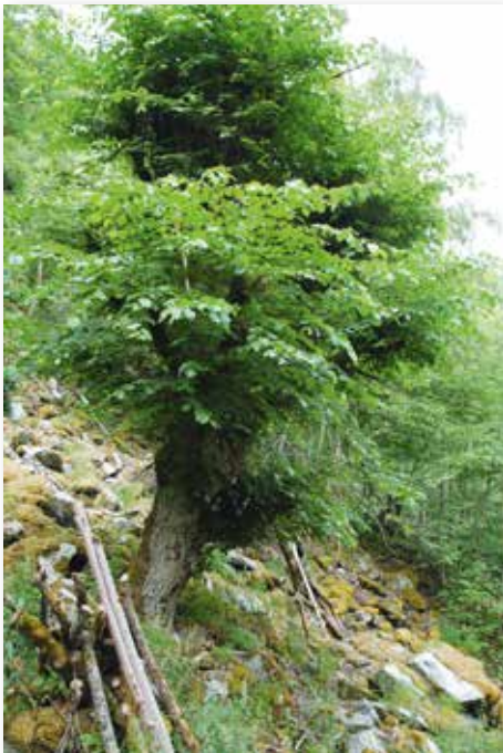
I bratte ller og steinurer vart lauvtree også styva og hausta til før. Restaurert styvingstre av alm.

Styvingstrea vert gjerne eldre enn andre tre og har difor stor verdi for det biologiske mangfaldet av mose, lav, insekt og fugl. Dersom ein skal vedlikehalde haustingsskogen må trekronene skjerast attende og haldast små. Tresjiktet må tynnast ut regelmessig og ein må sikre rekrutteringa av nye styvingstre. På Vestlandet kan det vere naudsynt med tiltak som hindrar hjortegnag på dei unge trea. Mange stader må ein også fjerne framande artar og artar som ikkje er ynskja, til dømes platanlønn.