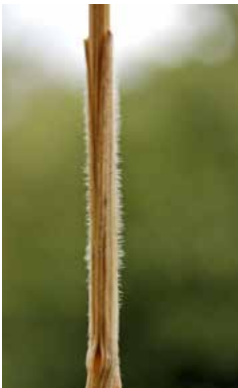
Den nederste delen av strået til dunhavre er håra.