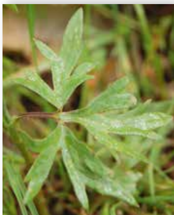
Blada hjå engsoleie har ein uskafta midtflik.

har fleire stader same namn som engsoleie, medan røtene hadde eigne namn. Vart mellom anna kalla brurasoleior (Hamre, Haus). Røtene vart kalla trauska (Rogaland, Hordaland, Sogn og Fjordane). Andre variantar er trønska (Rogaland, Hordaland, Fjaler, Luster), traunska (Røldal, Ullensvang), traumska (Kinsarvik, Kvam, Kvinnherad, Modalen, Ulvik, Voss, Vossestrand), tremaska (Voss, Vossestrand).