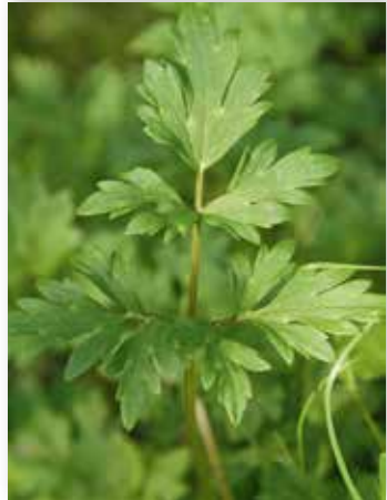
Blada hjå krypsoleie har ein skafta midtfluk.

Om engsoleie heiter det at «Avdrotten auka når smørblomen, R. acer , var komen» (Kvinnherad), men det er mogleg at planta fungerte som eit kalendermerke i dette tilfellet. Røtene til krypsoleie har i kyststroka vore nytta som naudfôr, sidan dei er svært rike på stivelse (Rogaland, Hordaland og Sogn og Fjordane). Vanlegvis vart røtene grava opp i våronna, skylt og gjeve krøtera som tilskot. Ofte var det husmannsfolk og andre meir dårleg stilte som måtte ty til dette føret. Det finst og døme på at røtene vart sankt om hausten: «Det har kanskje stundom om hausten vore brukt å samla trauska or åkrane, skilja molda av det og gjeva det til kyrne». «Dei nytta dei til kraftfôr, skylde dei og gav dei til kyrne. Husmennene grov ofte fóra og hadde trauske som betaling. Dei var fegne dei fekk det arbeidet» (Suldal). Røtene vart mange stader rekna som eit godt og næringsrikt for, og «Kjydnna mylktest tå da, sa dei gamle» (Hamre). Andre stader heitte det «helst naudfôr, dårleg»