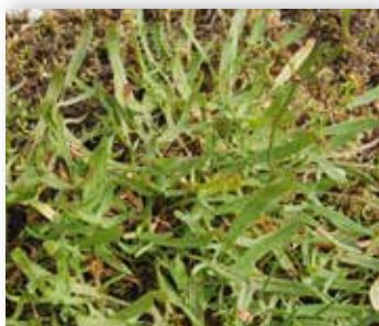
Småsyre har spydforma, smale blad med tilbakebøyde flikar.

mengden av oksalsyre er ikkje så stor at den skader». «Guttene spiste helst den øverste delen av den blomstrende stengelen» (Gloppen). « Syrestelken , blomstelken, er krasemat for alle gutungar når han er på det saftigaste» (Sunnfjord). «Brukes til salat, med sur fløte» (Høyland). « Syregras i maten» (Hafslo). «Ble mye gitt til grisen. Da slog de den tidlig» (Gloppen). «Nervøse folk skulle ete mykje syregras » (Vik).