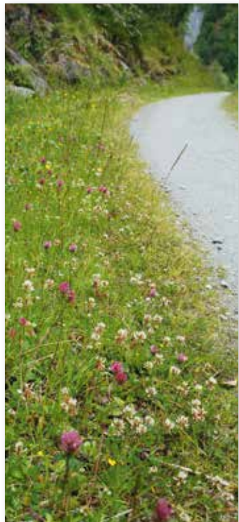
Mange vegkantar er artsrike, slik som i Fortunadalen.

næringsstoff og svak skjøtsel. Det store klimatiske spennet mellom aust og vest og lågland og fjell på Vestlandet gjer det vanskeleg å gje generelle skjøtselstilrådingar. Men generelt (med unntak av spesielle og svært tørre vegkantar i indre strøk) bør vegkantane verte slått minst to gonger årleg, ein gong tidleg i sesongen (siste del av mai-første del av juni) og ein gong etter at bløminga er over, gjerne i august.