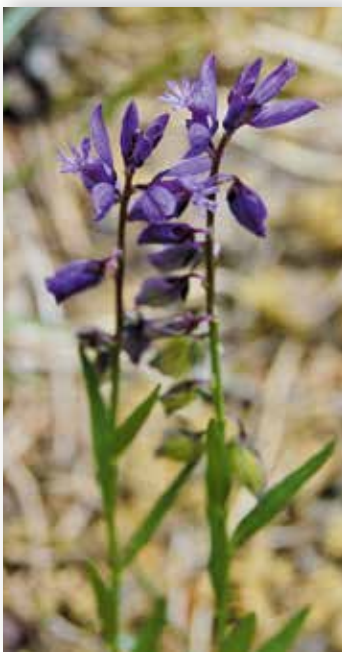
Storblåfjør: Foto: @ B. Bele/NIBIO.