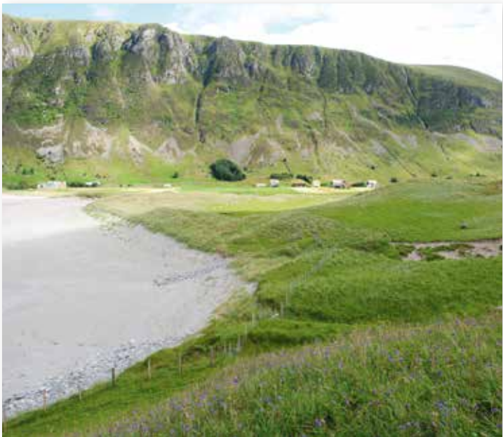
Dyneeng i Hoddevik ved Stadt.

Det er stort sett slutt på den tradisjonelle bruken av sanddynene. For å ta vare på dei artsrike områda som er att, er det best å følge opp den tradisjonelle drifta, fordi beiting og slått gjev ulik artssamansetjing. Beitepresset må ikkje vere for hardt då det kan føre til erosjon og sandflukt.