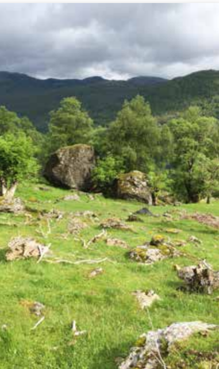
Naturbeitemark i Vindafjord, Rogaland.

Artsrike beitemarker er viktige for det biologiske mangfaldet og bør difor takast vare på og skjøttast. Aller helst bør ein nytte same husdyr og om lag det same beitestrykket som tidlegare, men sambeite kan vere positivt både for vegetasjonen og beitedyra. Blomerike beitemarker vert best skjøtta med storfe.