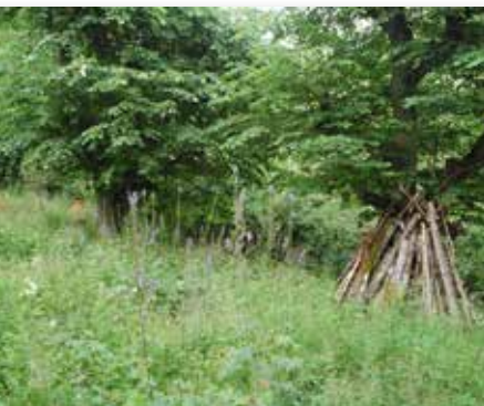
Lauveng under restaurering i Mørkridsdalen.

Handlingsplanen for slåttemark omfattar også lauvengene som i dag er ein svært sjeldan naturtype. Arealet av hagemark er også sterkt redusert. Attgrodde lauvenger og hagemarker kan restaurerast ved hogst og tynning av glenner og rydding av kratt. Vidare må slike areal følgjast opp med årleg slått eller beiting. Styvingstre som ikkje vert hausta, får etter kvart ei svært stor krone slik at dei lett går over ende ved store snømengder eller sterk vind. For å ta vare på slike tre, må dei difor restaurerast og etterpå styvast med jamne mellomrom.