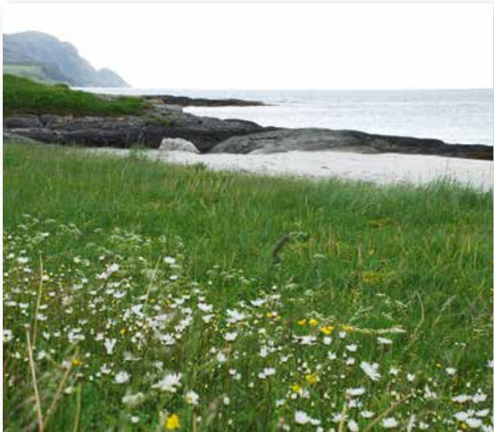
Strandeng ved Grotle i Bremanger.

Strandengene er spesielt viktige leveområde for fugl, og bør takast vare på og skjøttast. Tradisjonell beitedrift vil gjerne vere den beste skjøtselen.