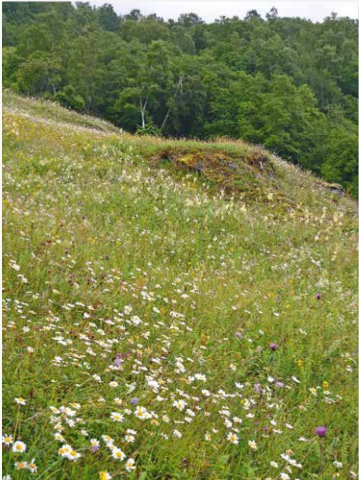
Artsrik slåttemark på Ormelid i Luster.

I dette arbeidet er det viktig at slåttemarkene vert skjøtta på tradisjonelt vis i høve til dei lokale tradisjonane og tilhøva. Ein må nytte lette maskiner eller reiskap, og høyet må fjernast etter slått. Dei fleste slåttemarkene har tidlegare vorte beita vår- og/eller haust. Det er viktig at dette også vidareførast. Elles kan det vere aktuelt å slå to gonger årleg, ein gong tidleg i sesongen (siste del av mai-fyrste del av juni) og ein gong etter at bløminga er over, gjerne i august.