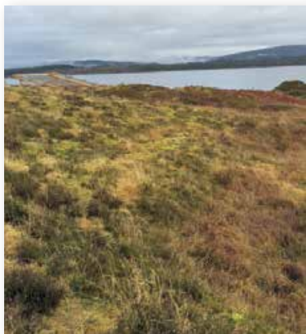
Kystlynghei på Lygra.

I dag er kystlyngheiane ein trua og raudlista naturtype med ein eigen handlingsplan. Gjennom arbeidet med handlingsplanen vert det sett fokus på restaurering og tradisjonell skjøtsel for å ta vare på naturtypen og artane knytt til den. Med unntak av dei som driv med utegangardrift, hovudsakleg med villsau, har den tradisjonelle bruken mange stader