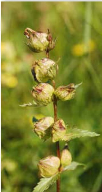
Småengkall med frøkapslar.