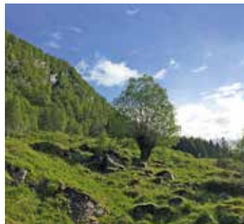
Beitemark med styva tre, Rogaland.