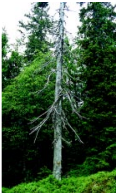
Dette treet døde for 57 år siden. To kvistordener er tilstede.

Gjennom flere århundrer fram til 1950 – 60 tallet ble skogene i Skandinavia drevet ved dimensjons- og plukkhogster. Dette førte til at mengden død ved ble redusert fordi det nettopp var de store og gamle trærne som ble hogd. Nå er skogbehandlingen i økende grad fokusert på å etterligne skogens naturlige dynamikk, for å ta hensyn til det biologiske mangfoldet.