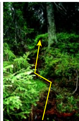
Nedbrytningsgrad 7. Treet falt for 75 år siden. Vi vet ikke når det døde.

Ved Skogforsk jobber vi med å finne sammenhengen mellom nedbrytningsgrad og hvor lenge det er siden treet døde eller falt overende. Vi har samlet informasjon om 173 liggende og 136 stående døde grantrær i urørt og i tidligere plukkhogd skog på Oppkuven, Ringerike i Buskerud. Trærne er datert ved hjelp av årringanalyser, fallsår i nabotrær og treforyngelse som har etablert seg på den råtnende stammen. For 61 av trærne har vi klart å bestemme både tidspunkt for død og