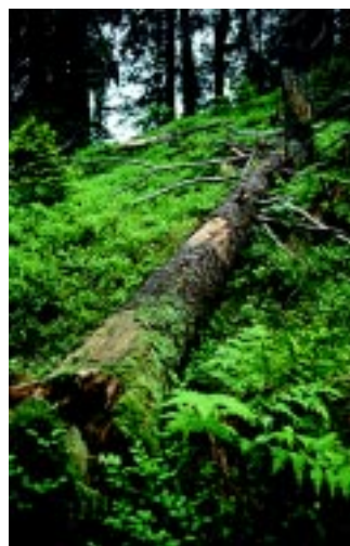
Nedbrytningsgrad 2. Treet døde for 48 år siden og falt for 4 år siden.

Data som beskriver nedbrytningshastigheten er helt avgjørende for å kunne estimere den fremtidige mengden død ved. Hvor lenge et dødt tre blir stående varierer med treslag, forholdene på stedet, klima og vedens evne til å motstå nedbrytning. I tillegg er dødsårsaken avgjørende. Et tre som dør av et insektangrep vil for eksempel kunne bli stående mye lenger enn et tre som dør av rotråte.