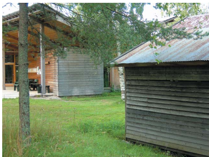
Ubehandlet grankledning på Naturinformasjonssenteret ved Fetsund Lenser.

En utvendig kledning skal, i tillegg til å gi bygningen et estetisk preg, også verne byggematerialer innenfor mot mekaniske påkjenninger og påvirkning av mikroorganismer og klima. For å oppfylle disse funksjonene er det avgjørende at kledningen har god holdbarhet.