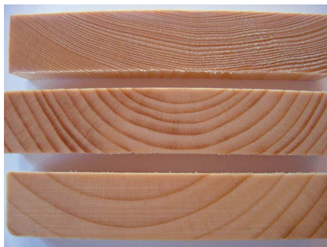
Jo smalere årringene er jo mindre mottakelig for fuktighet er kledningen.

Ved Skogforsk har vi gjennomført en studie for å belyse sammenhengen mellom årringbredde og vedegenskaper som har betydning for holdbarhet til ubehandlet utvendig grankledning. Hensikten var å vurdere hvorvidt årringbredde, og særlig årringbredde mindre