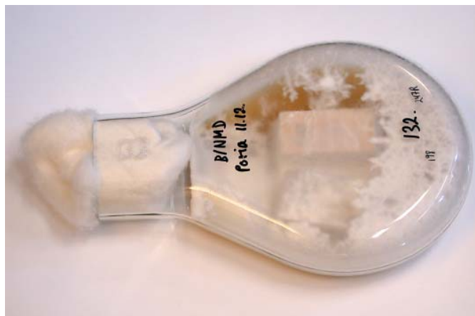
Nedbrytningstest med brun-råtesoppen Poria placenta . Dette er en norsk og europeisk prøvemethode for å bestemme den beskyttende effekten mot treødeleggende basidiomyceter (stilksporesopper).

Utvikling av fuktighet over tid i prøver av kledning av gran og furu. Margsiden var eksponert mot vann.