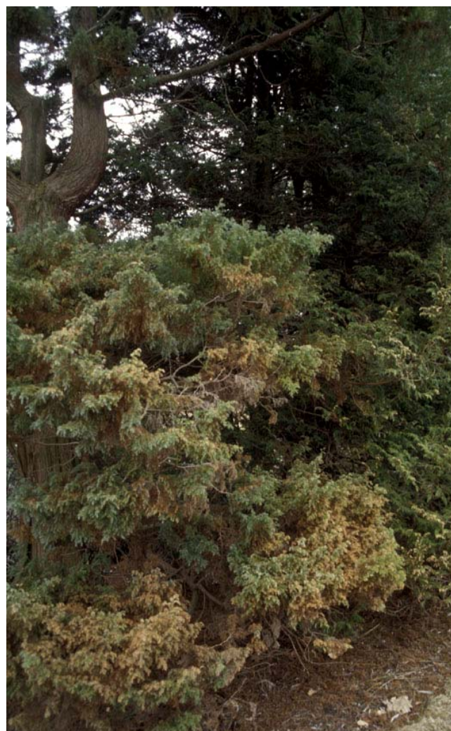
Fig. 1. Denne krussypressplanta ( Chamaecyparis pisifera 'Squarrosa') ved Svanedammen på NLH (planta i 1962) hadde i 2001 sterke angrep av Pestalotiopsis .

Fig. 1 syner ei krussypressplante som vart planta i 1962 ved Svanedammen på NLH.