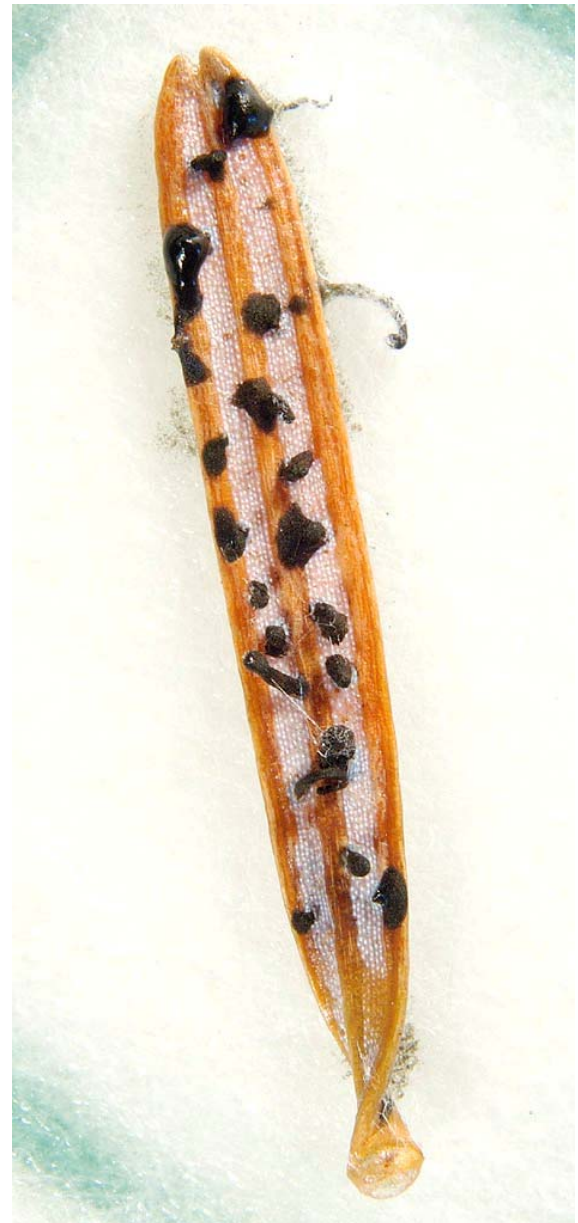
Fig. 4. Nål av nordmannsedelgran ( Abies nordmanniana ), som er full av sporehopar av soppen Pestalotiopsis sp. Kvar av desse svarte sporehopane inneheld tusenvis av sporar.

Her sporulerar Pestalotiopsis sp. på ein barprøve frå krussypresen som vart planta ved Svanedammen på NLH i 1962.