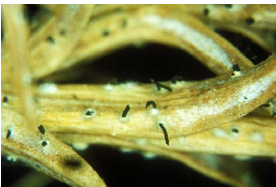
Fig. 2 og 3.

Her sporulerar Pestalotiopsis sp. på ein barprøve frå krussypresen som vart planta ved Svanedammen på NLH i 1962.