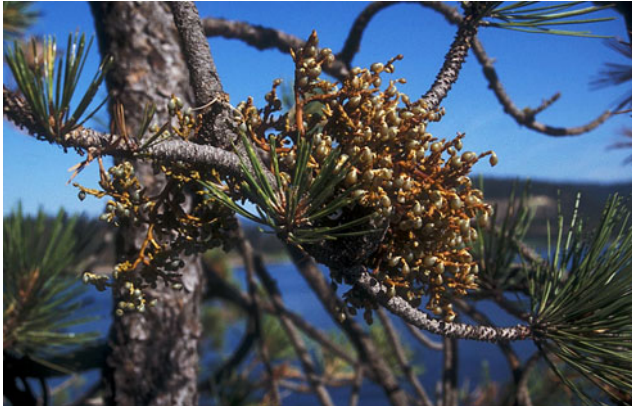
Fig. 2. Dette biletet av misteltein på furu er tatt hausten 2003 like ved byen Coeur d'Alene i Idaho i USA.

sporehusa tyt det ut gulaktig sporemasse i trådliknande krøllar (Fig. 6). Sporane er små og pølseforma (Fig. 7).