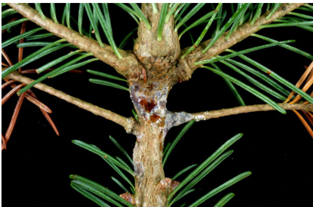
Fig. 3. Nærbiletet av eit parti av greina i Fig. 1. Biletet syner innsokken bark og kvæutflod der dei to sideskota har vorte ringa.