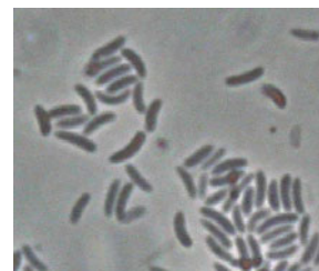
Fig. 7. Pølseforma sporar av Cytospora .