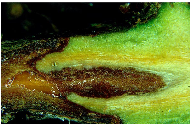
Fig. 4. Vevet under kreftsåra er brunt og danner ein skarp overgang til det vevet som enno er grønt og friskt.