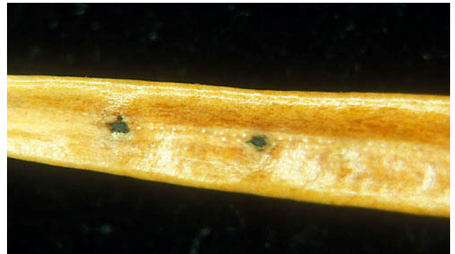
Fig. 5. Oversida av brun nål av fjelledelgran med svarte sporehus av Cytospora . Det er som regel relativt få sporehus pr. nål.