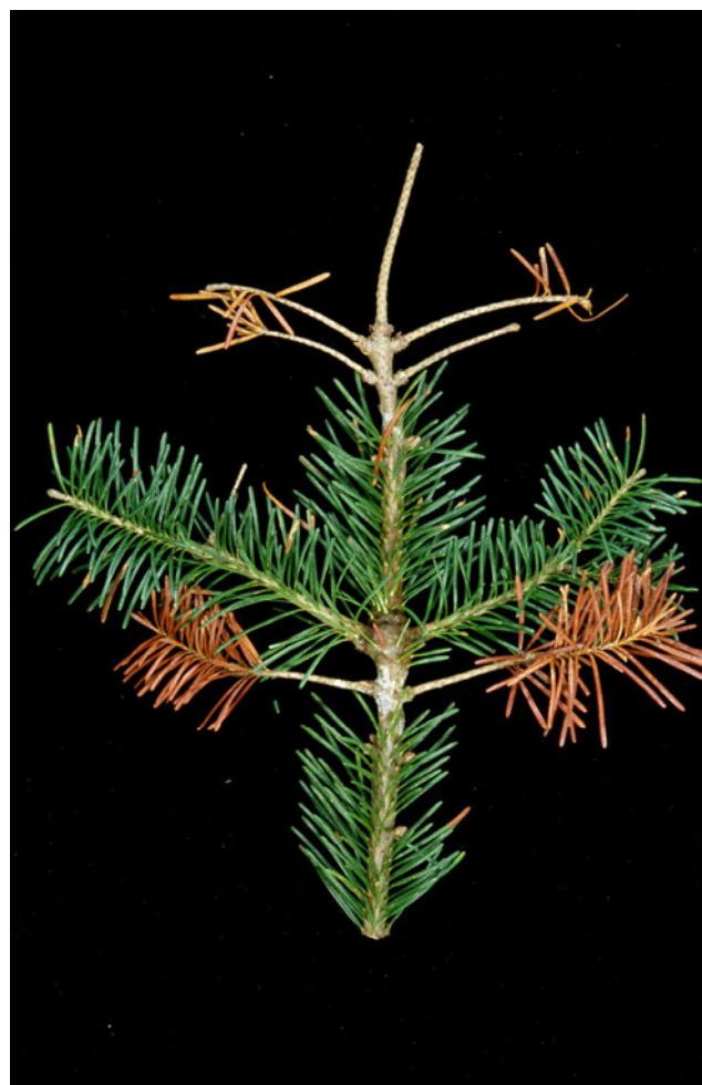
Fig. 1. Fjelledelgran der angrep av Cytospora sp. har ført til at tuppen på greina og to sideskot har vorte ringa (kreftsår) og dauda.

Det er ikkje noko å finna i norsk litteratur om Cytospora , men frå vestkysten av Nord Amerika er det rapportert at edelgran og av og til kystdouglas ( Pseudotsuga menziesii , vert angrepne av Cytospora abietis ( Valsa abietis ). C. abietis er ein skadeleg, kreftsår-dannande sopp, men vert likevel sett på som ein svak parasitt. Denne soppen angrip etter at andre soppar har gjort skade eller etter tørke, vindbrekk, skogbrann, insekt eller menneskeleg aktivitet (til dømes skjering). I Nord Amerika finn ein ofte angrep av C. abietis på tre som er infiserte med misteltein ( Arceuthobium ). I Noreg kjenner vi berre til misteltein (snylteplante) på lauvtre, men i USA er det mistelteinartar som går på furu (Fig. 2) og andre bartre. C. abietis fører til at greiner vert ringa og daudar (jf. Fig. 1). Tre i alle aldrar kan få angrep. Unge tre og/eller toppar på unge tre kan dauda. På større tre vert toppar og/eller sidegreiner drepne, men trea overlever. Barken vert innsokken der det er angrep, og ein ser ofte kvæutflod (Fig. 3).