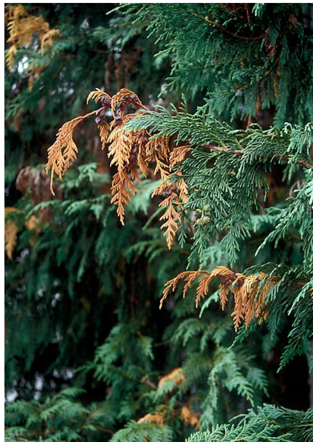
Fig. 2. Lawsonsypress med angrep av Kabatina tujae var. thuja .

På einer, tuja og syress vert skotspissane fyrst gule før dei ytterste 10-15 cm på årsskota daudar og vert brune (Fig. 2). Soppen angrip berre årsskota og veks ikkje innover til eldre delar av plantene. Overgangen er skarp mellom sjukt og friskt