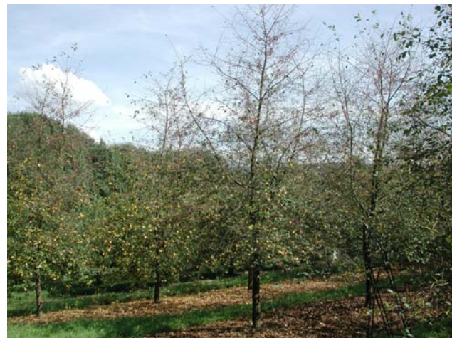
Figur 3. Omfattande bladfall ved hausting i surkirsebær.