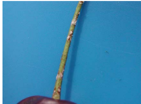
Figur 2. Heggeflekksymptom på fruktstilk av surkirsebær.

Det er skilnad mellom symptom på søt- og surkirsebær. Flekkane på søtkirsebær er større og meir sirkelforma enn tilsvarande på surkirsebær. Generelt er søtkirsebær mindre mottakelege enn surkirsebær. Det vert danna infeksjonar på søtkirsebær, men dei har lengre latent periode, færre flekkar og redusert sporulering frå flekkane (Sjulin et al., 1989). Omfattande bladfall er mindre vanleg på søt- enn på surkirsebær (Gjærum & Langnes, 1984).