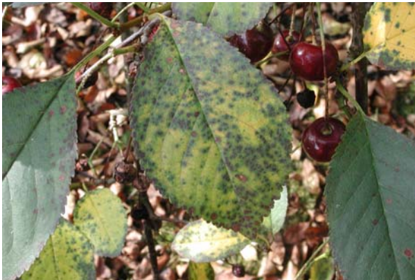
Figur 1. Heggeflekk på surkirsebærblad.

På blada kjem det først små raude eller lilla flekkar. Ved sterke angrep vert blada gule og fell av, men det er framleis eit grønt felt rundt infeksjonen på surkirsebær (Fig. 1). Under fuktige tilhøve vert det ofte danna ljos rosa eller kvit sporemasse på undersida av blada.