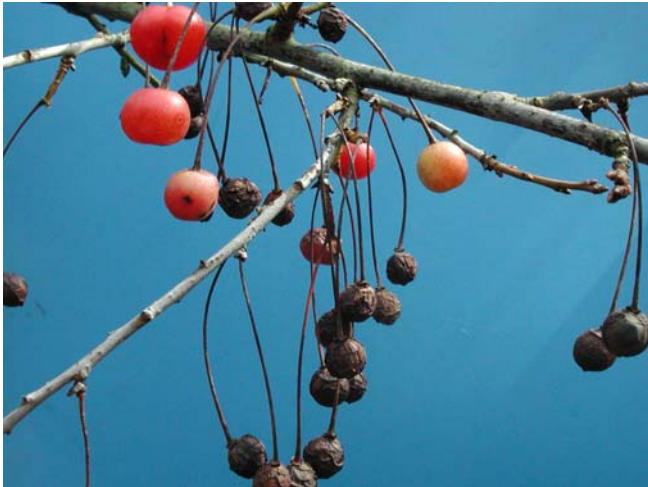
Figur 4. Underutvikla surkirsebærfrukter på eit tre med så sterkt angrep av heggeflekk og bitterrote at trea er nesten utan blad ved normal haustetid.

Ikkje berre vert fruktene dårleg utvikla i den sesongen der det er omfattande skade, men effekten kan også vara inn i året etter. Dersom det er sterke angrep året før, kan både avlingsnivået og fruktstorleiken gå ned året etter (Keitt et al., 1937). Ved infeksjon av heggeflekk vert det akkumulert ulike flavanolar i blada, og ved forsøk med dyrking av soppen i kultur ( in vitro ) vil desse fremja sporespiring og hemma infeksjonsraten (Niederleitner et al., 1994). Wharton et al., (2003) hevdar at denne akkumuleringa er eit teikn på stress, av di desse flavanolane er utbreidde i planter i rosefamilien og har liten hemmande verknad mot sopp.