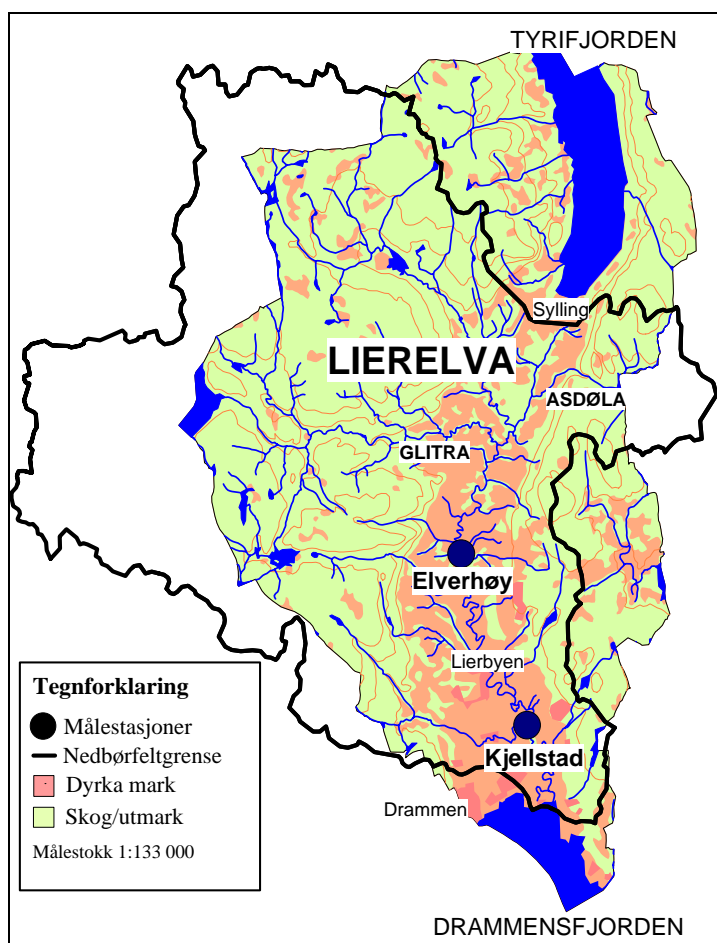
Figur 1. Lierelvas nedbørfelt med målestasjoner. Utarbeidet fra Statens kartverks digitale kart for Lier kommune. Nedbørfeltgrensene er hentet fra NVEs REGINE-områder.

Nedbørfeltet til Lierelva er 302 km 2 . Det ligger hovedsakelig i Lier kommune, men omfatter også arealer i Drammen, Nedre Eiker, Modum og Asker kommuner. Landbruksaktiviteten i nedbørfeltet er preget av intensivt jord- og hagebruk. Om lag 80 % av jordbruksarealet i Lier kommune drenerer mot Lierelva (Figur 1).