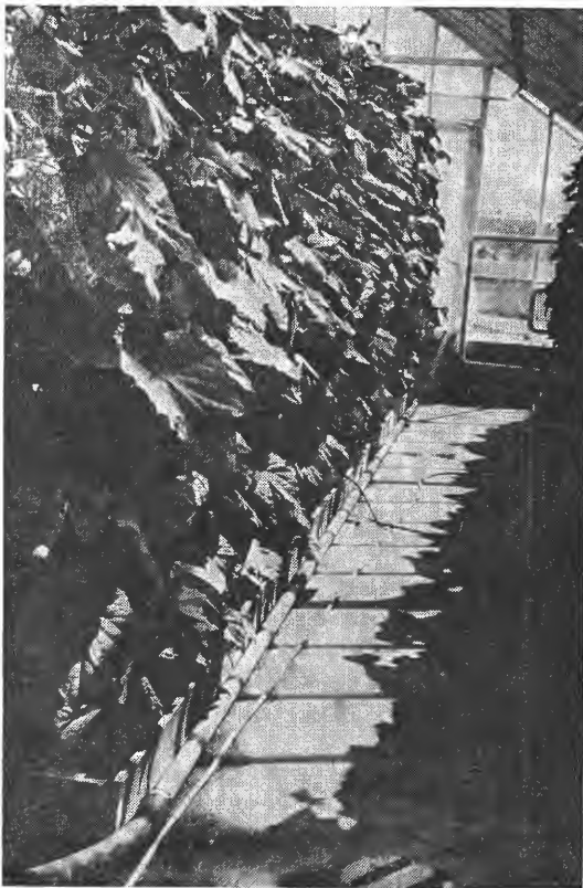
Fig. 1. Agurkplanter på støpt bunnplate. Agurk og tomat har vært dyrket i 15 cm tykt lag torv som vekstmedium. Det er for tidlig å si om dette skal bli fremtidens kulturmåte. Men det ser lovende ut og byr på mange fordeler. I betongplaten kan med fordel støpes inn varmerør av plast.

Syreløselig fosfor (P-HCl) viser igjen alt som tilsettes av fosfor, også med råfosfaten. Med Ca-AL analysen tas derimot ut bare noe under halvparten av det som er tilsatt av kalsium.