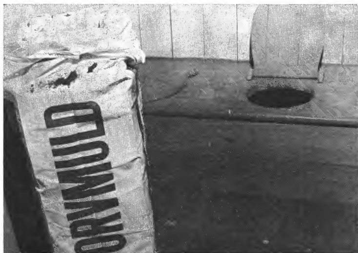
Torvpakningene bør være for hånden ved «hullet», slik at nødvendig overdryssing lettvis kan foretas.

Avfallet fra do hvor det er nyttet torv, er et allsidig gjødsel- og jordforbedrings-produkt, men det kan være noe surt for de fleste planteslag. Når avfallet blandes i jorden eller legges i kompost, kan det derfor tilrås å tilføre kalkingsmiddel, f.eks. 1—1½ kg kalkdolo-