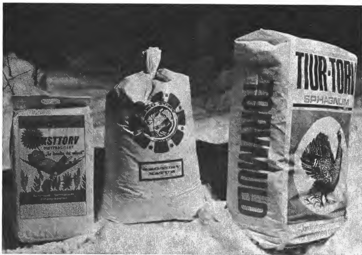
Norske torvprodukter finnes i tette, hendige pakninger av forskjellige størrelser.

I eldre tid var det vanlig å bruke torvstrø i do. Denne suget til seg urin og hindret i en vesentlig grad sjenerende lukt (alt etter hvor meget torvstrø som ble brukt). I dag har kjemikalieklosettene fått en stor utbredelse der en ikke har vannklosett. Men «vellingen» fra disse klosettene kan, som Forbruker-rapporten påpeker, skaffe betydelige problemer.