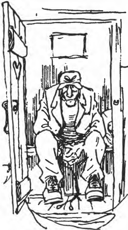
e. Aukrust, «Bror min».

Sitatet er hentet fra artikkelen «Viktige hull i vår tilværelse» i Forbruker-rapporten nr. 8 for 1966. Det er avfallet fra kjemikalieklosettene som omtales.