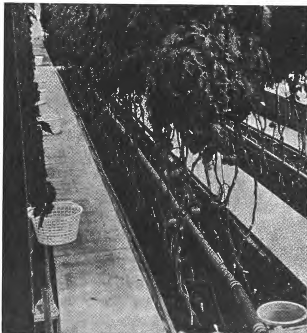
Tomatdyrking i torv. I forgrunnen ses et peilepunkt for vannstanden i det 28 cm tykke torvlaget.