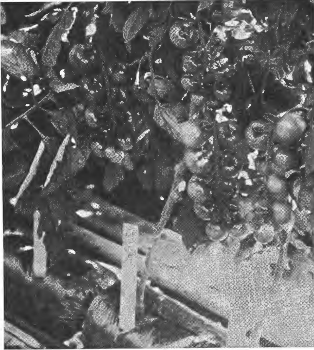
Tomat dyrket i torv i plastfoliepølser.

liter løst dyrkingsvolum med torv. Vi er da tilbake til en dyrkingsmåte som meget minner om dyrking i gamle sink renovasjonsbøtter slik det var vanlig for noen år siden i Danmark, med bruk av jord.