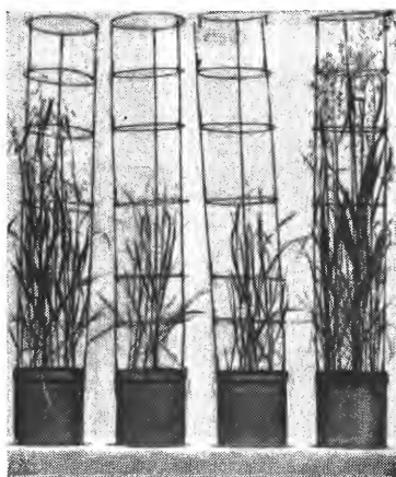
b e g h

6. Ubalansert næringstilgang resulterer ofte i hemmet opptak gjennom røttene eller hemmet transport i plantene av visse næringsstoffer. Mange slags fysiologiske vekselvirkninger og samspill mellom næringsstoffene har betydelig praktisk interesse. De ytrer seg oftest som antagonisme, dvs. ved et konkurranseforhold, slik at stort overskott av et stoff induserer relativ mangel på et annet. I sjeldnere tilfeller kan knapp forsyning med ett bestemt stoff virke til at det også blir