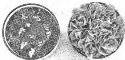
pH 5,0 pH 5,7 Fig. 2. Salat dyrket i kvitmosetorv.