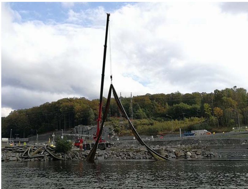
Figur 7. Den siste siltgardinen heves ved hjelp av kran. Siltgardinen er bundet sammen med flyteslangen hver 4-6 m.

Klargjøring av denne siltgardinen i forkant av opptak foregikk på samme måte som for de andre siltgardinene. Kjetting og duk ble løsnet fra hindringer i sjøbunnen og bundet sammen med flyteslangen. Avstanden mellom hvert punkt for sammenbinding var 5 – 6 m (fig. 7 og 8). Dette ble gjort for å lette opptak av siltgardinen, og for å redusere partikkelbelastningen i vannet. Målinger av dybde i området rett på utsiden av siltgardinen viste en variasjon mellom 6 og 8 meter. Variasjonen hadde trolig sammenheng med tømmer som ligger på bunnen. Ved et par anledninger traff målesonden tømmerstokker. Den høyeste verdien for turbiditet ble målt i denne sammenhengen: 5,9 NTU. For å unngå at sonden traff flere stokker ble videre målinger ved målepunkt FØ utført grunnere enn 6 m. Mellom FØ og FA1 ble målinger foretatt ned til 12 meters dyp.