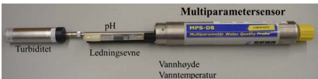
Figur 2. Multiparametersonde for automatisk overvåking av vannkvalitet.

Under opptak av den ytterste siltgarden ble målinger av turbiditet utført med multiparametersonde av typen KLL-Q fra Seba Hydrometrie (fig. 2 og 3). Multiparametersonden hadde samme sensorutrustning som miljøbøyene benyttet under overvåking av anleggsfasen (Roseth m.fl., 2017). Målinger ble foretatt på tilnærmet lik plass som stasjonene FØ, FA1, FA2 og FA3 (fig. 4). Her ble temperatur og turbiditet målt for hver meter ned til 15 m dyp. Ved FA2 ble det i tillegg målt nær til maksdyp ved ca. 30 m. Ved FA3 ble målingene fortløpende sammenlignet med målinger fra FA2. Det gjøres oppmerksom på at målepunkt var noe mer midtfjords enn FA3. I tillegg ble det tatt stikkprøver fra varierende dyp nær den delen av siltgarden hvor dykkerne til enhver tid arbeidet. Det ble vurdert som nødvendig å ha oversikt over vandedybde nær siltgarden for å unngå at målesonden traff bunnen og i verste fall ble sittende fast mellom tømmerstokker. For å måle dybde ble det benyttet en håndholdt dybdemåler av typen Plastimo Echotest II.