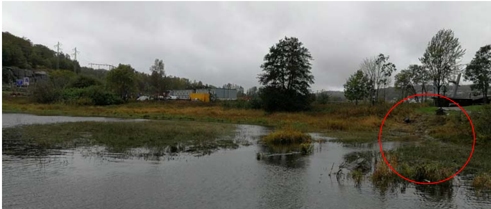
Figur 5. Grunt område med siv- og takrørvegetasjon hvor siltgardinene ble trukket opp (rød sirkel). Bunnen er preget av mudder og leire.

For overvåking av turbiditet i Farriskilen ble multiparametersonden, KLL-Q, benyttet. Målinger ble foretatt ved de bryggene som ikke var avsperrert med port, samt ute ved Kilgapet – målestasjon KIL (fig. 4). I Farriskilen er det mudderbunn, og kantvegetasjon er preget av takrør og siv (fig. 5). Det var forventet at dette ville påvirke turbiditeten ved opptak.