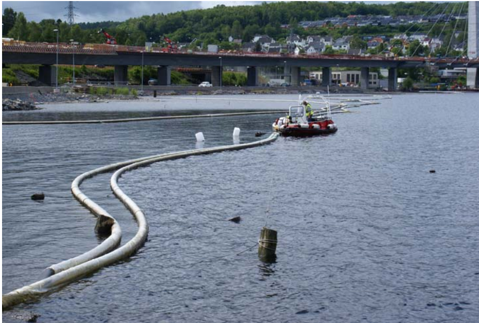
Figur 1. Oversiktsbilde som viser siltgardinene ved Farris Øst før opptak.

Under opptak av de indre siltgardinene (fig 1), ble det vurdert som tilstrekkelig å måle turbiditet ved uttak av vannprøver og turbiditetsmålinger med håndholdt måler (Hanna HI 93703, turbidimeter).