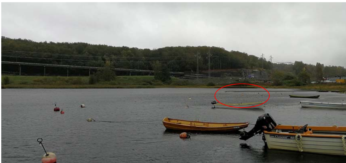
Figur 10. Bilde som viser enden av siltgardinene under opptak (rød sirkel). Feltet med grumset vann følger i rett linje etter siltgardinene.

I forkant av opptaket hadde det regnet mye og det var tidvis sterk vind. Det ble observert et felt med tydelig grumset vann rundt og bak siltgardinene da de ble dratt i land (fig. 10). Dette feltet så ut til å følge vindretningen, slik at partiklene havnet inn mot den østre delen av Farriskilen. Der siltgardinene ble dratt opp ble det maksimalt målt 116 NTU. Vannet i den innerste delen av Farriskilen var tydelig blakket. Det ble foretatt turbiditetsmålinger ved Kilgapet 15 og 30 minutter etter opptak, der den høyest målte verdien var 2,3 NTU. Det var ingen synlig blakking av vannet her. Etter 45 minutter ble turbiditeten i den innerste delen av Farriskilen målt til 18 NTU. En time etter opptak av siltgardinen bedret været seg betraktelig og vinden avtok. Dette antas å ha bidratt til raskere sedimentasjon av partiklene som ble virvlet opp under opptaket.