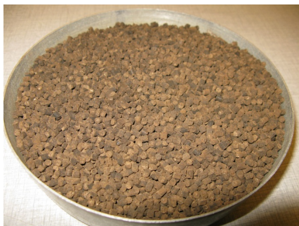
Bilde 1. Utseende til Minorga-gjødsla. Photo 1. Photo of the Minorga-fertilizer

Kornfordelingsanalysen viste at hoveddelen av Minorga-pelletsen hadde diameter mellom 2,0 og 4,0 mm (figur 1). Utseende til gjødsla som ble brukt i forsøket er vist i bilde 1.