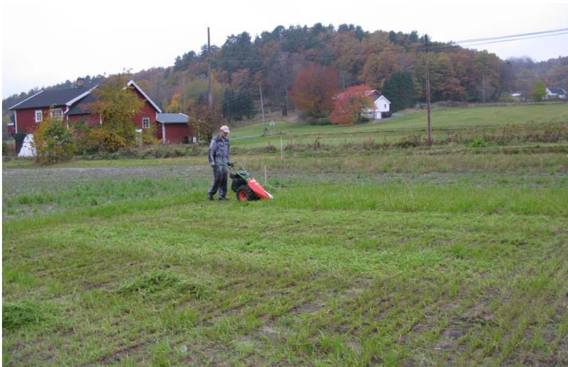
Bilde 3. Andre slått (ettervirkning) 24. oktober.

I middel for de tre ulike N-nivåene var TS-avlingene ved første og andre slåttetid henholdsvis 13 og 7 % høyere på ruter gjødslet med Minorga enn med Yara-gjødsel (tabell 6). Forskjellen var imidlertid ikke signifikante ved noen av slåttetidene.