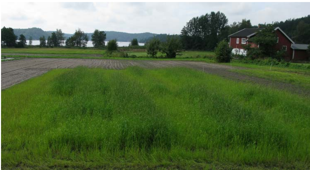
Bilde 2. Oversikt over feltet på Landvik like før første høsting 25. september.

Photo 2. The field trial at Landvik before first harvest on September 25.