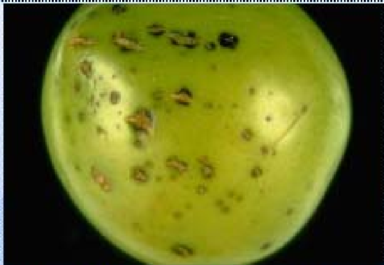
Spots on a plum fruit ( Prunus domestica cv. Shiro). U. Mazzucchi, Università degli Studi, Bologna (IT).