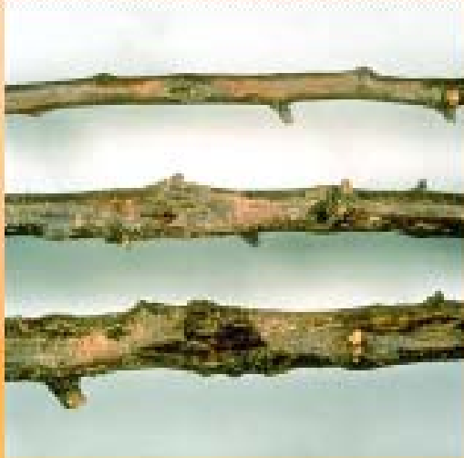
Cankers on three plum branches ( P. domestica cv. Calita). U. Mazzucchi, Università degli Studi, Bologna (IT).