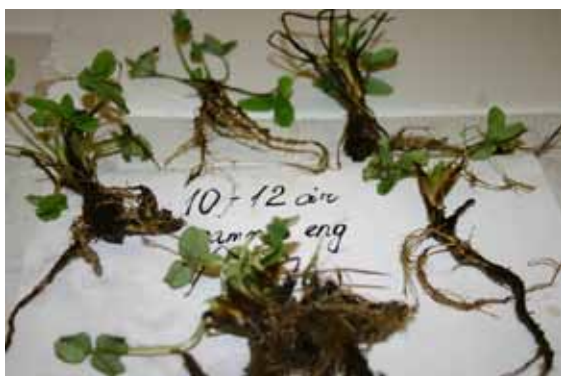
Foto 5. Raudkløver frå 10-12 år gammel eng, merk rotsystem.