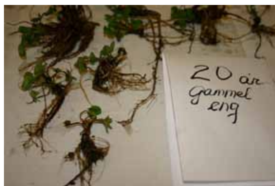
Foto 6. Raudkløver frå 20 år gammel eng