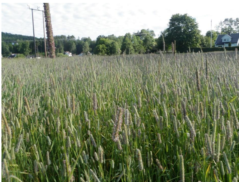
Bilde 2. Timoteifrøeng med høyt avlingspotensiale på Landvik i 2014.

Figur 2 viser et høyt avlingsnivå for alle tre arter i 2014. For engsvingel og raigras var nivået i Aust-Agder omtrent som landsgjennomsnittet, men for timotei var det litt lavere. Det skyldes sannsynligvis at frøavlen i Aust-Agder foregår på dårligere arronderte arealer enn på Østlandet. Alt i alt viser figur 2 likevel at i snitt for de siste tre åra er avlingsforskjellen mellom Østlandet og Sørlandet redusert.