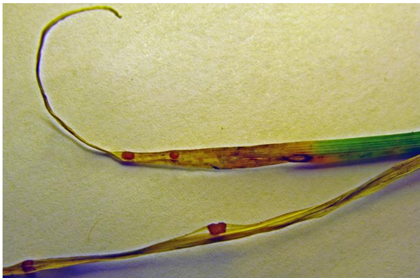
Bilde 3. Raigrasblader henta fra usprøyta ruter på feltet i Grimstad tidlig om våren viste at de var smitta med rød grastrådkølle ( Typhula incarnata ).

Som hovedeffekt hadde verken N-gjødsling om høsten eller avpussing om høsten eller våren sikker virkning på frøavlingen. Andre forsøk i samme serie har vist at høstgjødning er positivt bare i år med tørre forhold om våren og sommeren. Under slike forhold kan det være positivt at opptaket av nitrogen kommer i gang allerede om høsten.