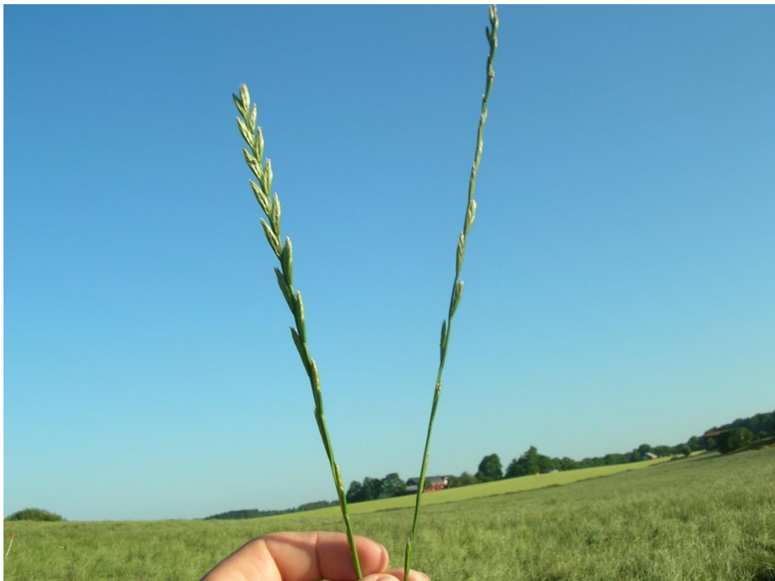
Bilde x. Frøtopper av raigras.

Oppfølginga av individuelle frøavlere i regi av NLR Agder bestod bl.a. i en ringerunde på slutten av året til dem som deltok på frøavlskurset i 2013 og som ennå ikke hadde tegnet frøkontrakt. Pr 11.mars 2015 har denne ringerunden dessverre bare resultert i en ny frøkontrakt. Det er derfor fortsatt stort behov for individuell oppfølging og kontakt.