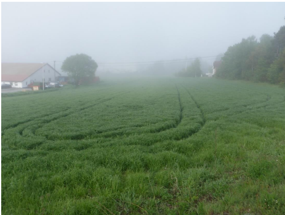
Bilde 1. Frøeng av raigras 'Figgjo' på Bergemoen, Grimstad, kort tid etter vekstregulering i mai 2014.