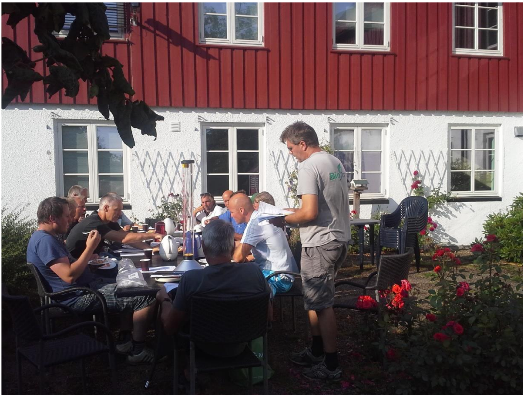
Bilde 5 a,b.Frøavlere samla på Landvik 28.juli 2014