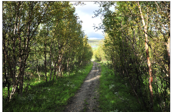
Gjengroing med fjellbjørk langs pilgrimsleden over Dovrefjell. Ensaldret og tett fjellbjørk reduserer utsikten og tilgangen til fjellområdene langs leden.

I utgangspunktet er gjengroing med kratt og skog en nøytral prosess som kan ha både positive og negative effekter. For eksempel vil gjengroende skog bidra i viktige økosystemtjenester, binde CO 2 og bygge opp biomasse til bruk som bioenergi. På den annen side vil gjengroende skog hindre