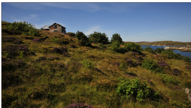
Begynnende gjengroing av kystlynghei på Frøya, Sør-Trøndelag.

Hovedmålet med forskningsprosjektet var å øke den forskningsbaserte kunnskapen om relasjonene mellom jordbrukets kulturlandskap og reiselivets bruk av og behov for dette landskapet, deriblant kulturminner. Prosjektet var virksomt fra 2009 til 2014. Forskningsprosjektet var et kompetanseprosjekt med brukerfinansiering (KMB). Norges Forskningsråd finansierte 80% av prosjektet via programmet Natur og næring. Våre prosjektpartnere finansierte de resterende 20%. Fem prosjektpartnere bidro både med egeninnsats og finansiering: NHO Reiseliv, Norges Bondelag, Riksantikvaren, Norges Skogeierforbund og Innovasjon Norge. Cultour involverte forskere fra Norsk institutt for skog og landskap, Senter for bygdeforskning, Transportøkonomisk Institutt, The James Hutton Institute (Skottland) og Swiss Federal Institute for Forest, Snow and Landscape Research.