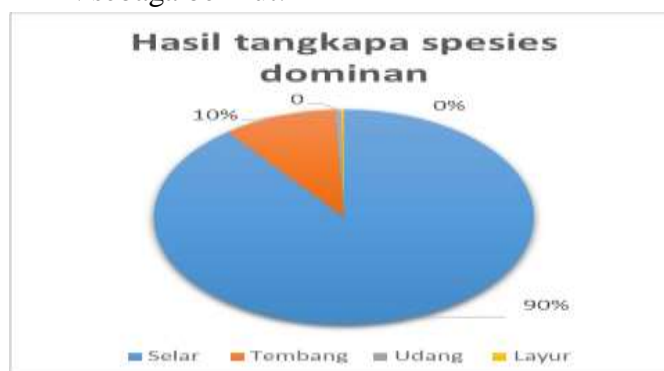
Gambar 2. Hasil tangkapan spesies dominan di lokasi PKN

Hasil tangkapan di lokasi PKN yang sangat beragam merupakan ciri bahwa ikan masih banyak berada di fishing ground tersebut sehingga nelayan tidak jauh menangkap ikan. Para nelayan di daerah ini yang dominan menggunakan alat tangkap dengan jangkaun wilayah pesisir pantai sehingga hasil yang diperoleh lebih banyak jenis ikan pelagis kecil yang berada di permukaan perairan, seperti ikan selar, tembang, layur dan ada beberapa jenis udang. Persentase jenis hasil tangkapan spesies dominan yang tertangkap di lokasi PKN sebagai berikut: