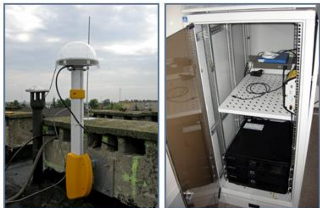
Rys. 5. Infrastruktura techniczna stacji referencyjnej RYKI [14]

W eksperymencie zostały wykorzystane dobowe obserwacje GPS w formacie RINEX 2.11 ze stacji referencyjnej RYKI w województwie lubelskim. Stacja RYKI stanowi część systemu precyzyjnego pozycjonowania satelitarnego na obszarze Polski (ASG-EUPOS), a jej infrastruktura została umieszczona na dachu Starostwa Powiatowego w Rykach (rys. 5).