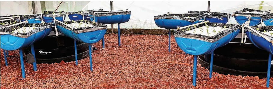
Figura 2. Sistema acuapónico para la producción de lechugas en un sistema de raíz flotante, abastecido de nutrimentos a partir de los efluentes del cultivo de tilapias.

su adopción y apropiación es que los productores requieren de conocimientos técnicos básicos para manejar ambos sistemas (acuicultura e hidroponía) como una unidad acuapónica, dada su tradicional tendencia a producir solo plantas. Por ello, se deben desarrollar estrategias en paralelo que permitan capacitar a los potenciales productores con mayor eficiencia y rapidez.