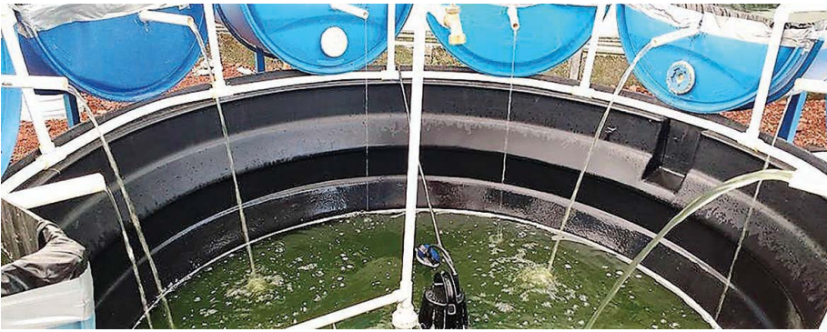
Figura 1. Sistema de recirculación del efluente acuícola para la oxigenación y purificación del sistema acuapónico.