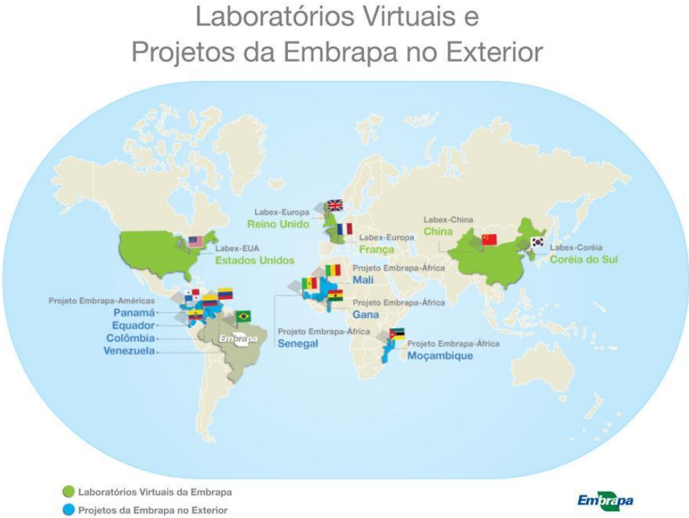
Figura 1: Laboratórios Virtuais e Projetos da Embrapa no Exterior

A instituição está presente em quase todos os Estados da Federação e nos mais diferentes biomas brasileiros por meio de suas unidades descentralizadas. Além de ser a maior empresa de pesquisa agropecuária brasileira, a Embrapa tem intensificado sua atuação internacional por meio de projetos e da criação de Laboratórios Virtuais da Embrapa no Exterior - Labex, tornando-se presente em outros países na América do Norte, na Europa, na Ásia, na África e na América Latina (figura 1).