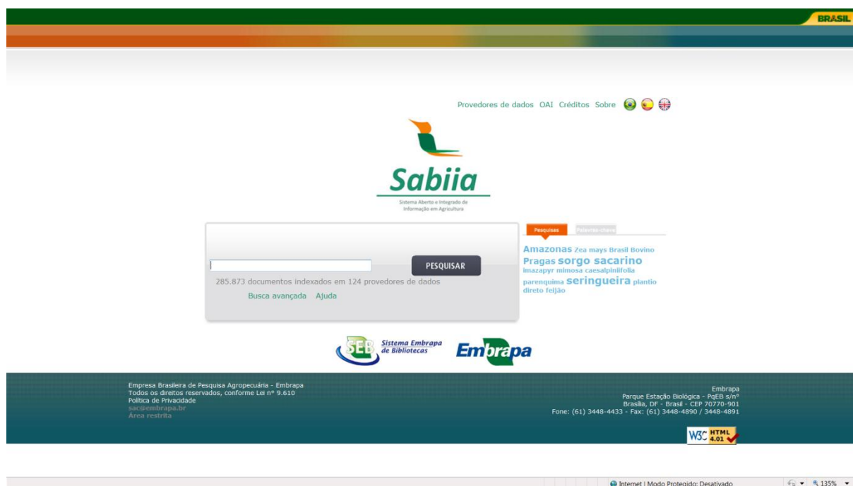
Figura 6: Sabiia (Sistema Aberto e Integrado de Informação em Agricultura)

O Sabiia, assim como todos os demais serviços de informação do projeto acesso aberto, é completamente desenvolvido com software livre. A escolha das soluções de software livre para sua implementação resultou de várias análises e testes de desempenho de seis ferramentas de coletores de metadados. O serviço foi desenvolvido com o software jOAI como coletador de metadados Solr, como ferramenta de indexação e busca textual. Além disso, o Sabiia utiliza a arquitetura Java EE (Java Server Pages e Servlets) para implementação da interface web de busca e o servidor de aplicações Apache Tomcat.