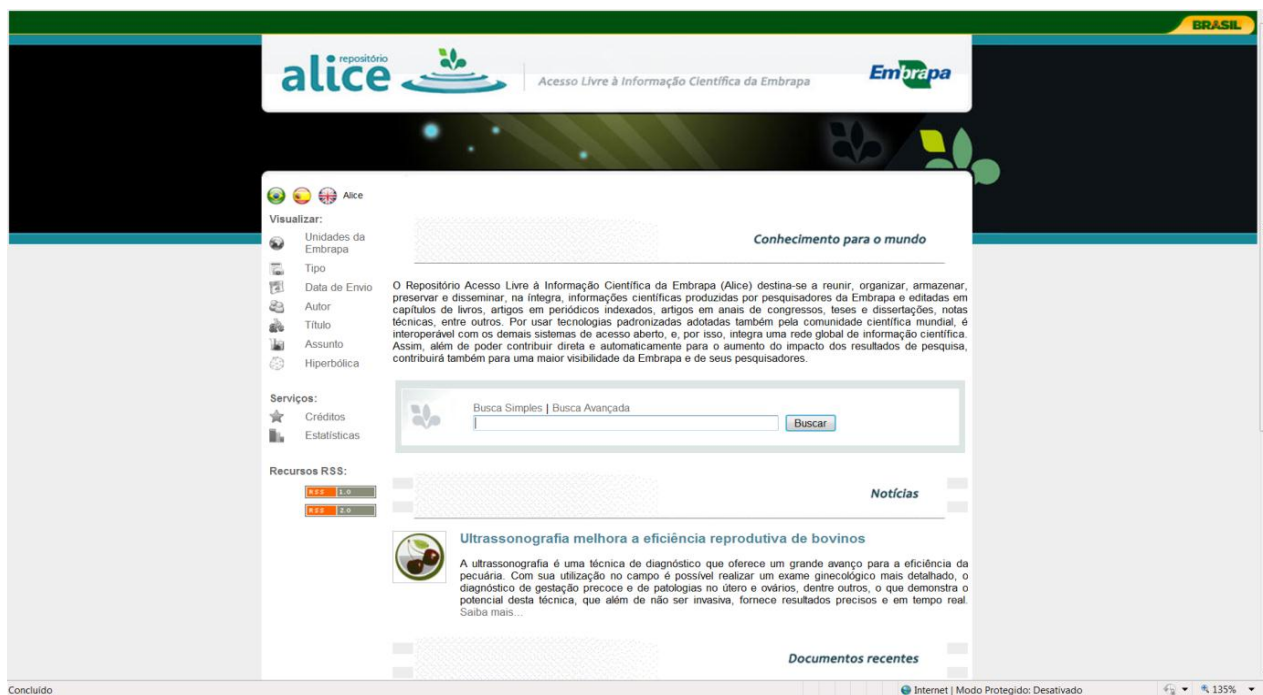
Figura 4: Repositório Alice (Acesso Livre à Informação Científica na Embrapa)