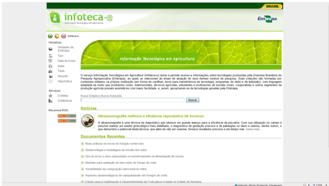
Figura 5: Infoteca-e (Informação Tecnológica em Agricultura)

Conforme previsto em seu modelo norteador, a gestão da informação científica da Embrapa com base no acesso aberto considera não apenas a informação que resulta das atividades de pesquisa, mas também a informação que é necessária para se fazer pesquisa. Por esta razão, para a busca unificada em serviços de informação internos e externos à instituição, criou-se o Sistema Aberto e Integrado de Informação em Agricultura - Sabiia (figura 6). O serviço de informação é um mecanismo de busca automatizado que coleta e centraliza metadados de provedores de dados científicos de acesso aberto, previamente selecionados. Em uma única interface, o serviço reúne informações sobre agricultura e áreas afins, possibilitando o acesso ao texto integral de milhares de publicações científicas disponíveis em diversas instituições nacionais e internacionais. O Sabiia permite o acesso a documentos como livros, capítulos de livros, artigos em periódicos, folhetos, teses, anais de eventos, entre outros.