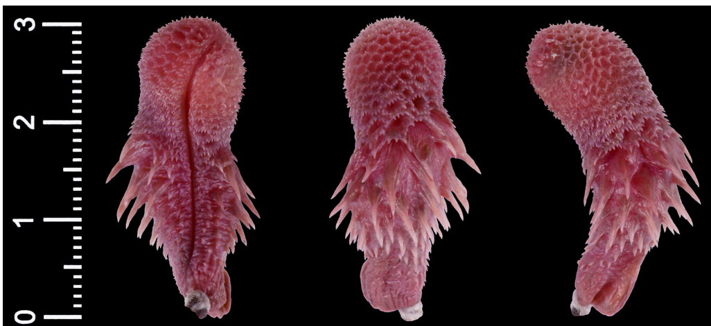
Figura 3. Hemipene izquierdo de Rhinobothryum bovallii (MHNUC-He-Se-0693) en vista sulcada (izquierda), asulcada (centro) y lateral (derecha). Escala en cm.

especies de Rhinobothryum son muy similares, específicamente en cuanto a su forma cilíndrica, sulco espermático simple, la presencia de espinas osificadas prominentes, lóbulo único y calculado. Sin embargo, el órgano expandido y totalmente evertido de R. lentiginosum presentado por Montingelli et al. (2019: Figura 3b), preparado con las mismas técnicas y de tamaño similar, permite una comparación más apropiada de la morfología hemipeneal de ambas especies. De acuerdo a esto, observamos que el órgano de R. bovallii en general es más robusto que el de su congénere, que el ápice del capitulum es completamente redondeado (vs levemente redondeado), y que la base del órgano de R. lentiginosum no posee un bolsillo profundo ni lóbulos prominentes. No obstante, estas diferencias que se proponen de manera preliminar deben ser evaluadas posteriormente mediante estudios que incluyan análisis de hemipenes de múltiples muestras.