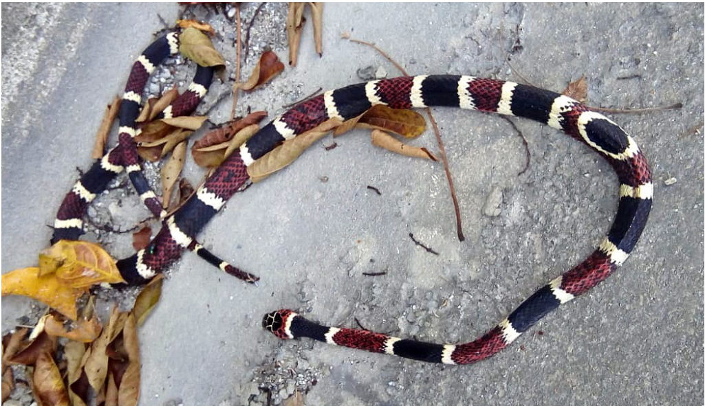
Figura 5. Individuo de Rhinobothryum bovallii (MHNUC-He-Se-000713) atropellado entre el corregimiento El Valle y el municipio de Toledo, Antioquia.

El conocimiento de los aspectos biológicos y ecológicos de R. bovallii ha aumentado considerablemente en la presente década, especialmente en cuanto a lo relacionado con su distribución geográfica, sus relaciones filogenéticas y amenazas. Se espera que en