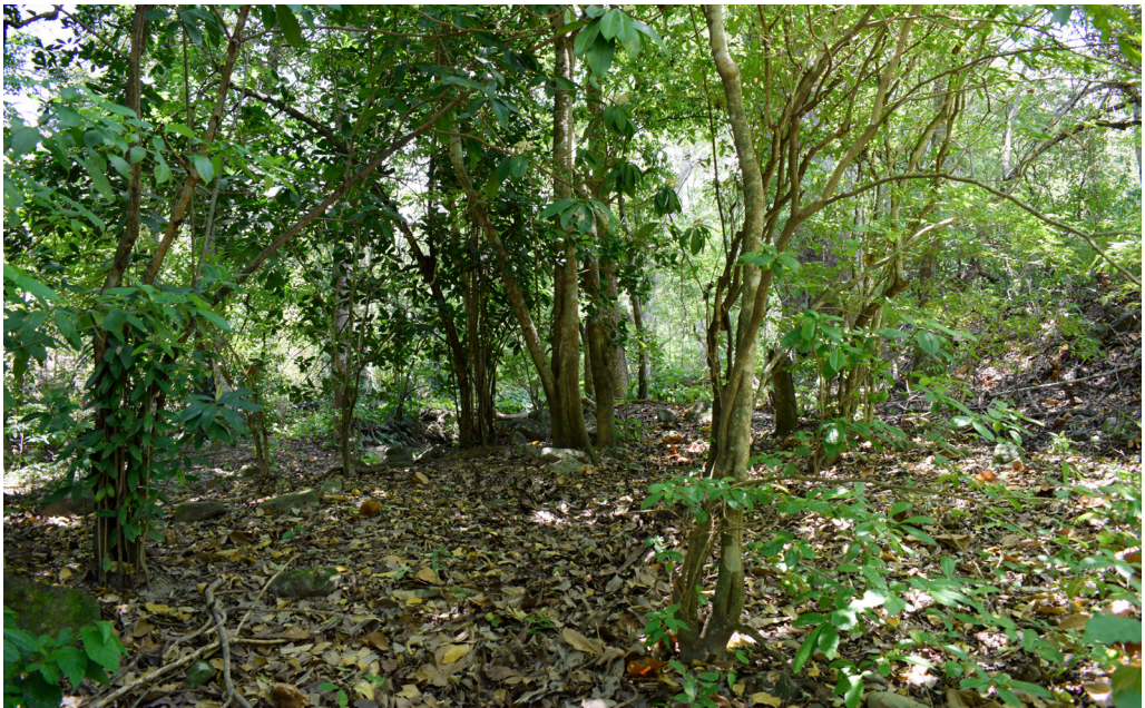
Figura 4. Bosque seco tropical en la vereda Zumbador Bajo, corregimiento La Victoria de San Isidro, municipio de La Jagua de Ibirico, Cesar.

R. bovallii (ver Pazmiño-Otamendi, 2019), coincidimos también con el criterio de otros autores con respecto a que es una especie raramente observada (Savage, 2002; Köhler, 2003; Rojas-Morales, 2012). Según Arredondo et al. (2017), esta baja tasa de encuentro puede estar relacionada con un esfuerzo de muestreo inadecuado, teniendo en cuenta que la especie es principalmente de actividad nocturna y de hábitos tanto terrestres como arbustivos que incluso alcanzan el dosel (Savage, 2002; Pazmiño-Otamendi, 2019). De hecho, el individuo registrado en la localidad 2 (Tabla 1) fue observado mientras ascendía en un árbol de Ceiba sp. de gran porte, utilizando sus púas como soporte. Por otra parte, el individuo de la localidad 1 se encontró a 2,5 m de