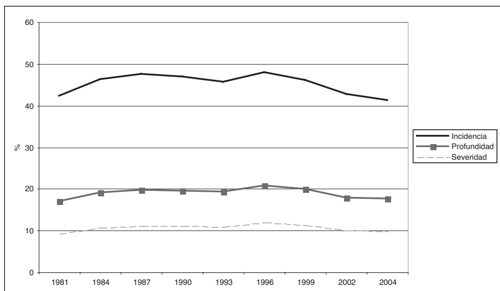
Gráfico 2. Indicadores agregados de pobreza absoluta en África