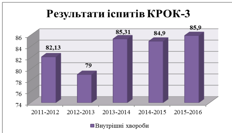
Рис. 2 . Результати іспитів КРОК-3

Традиційний підхід до організації учбового процесу на кафедрі сприяє формуванню клінічного мислення, вдосконаленню практичних навичок, а також підготовку до «Крок 3», комп'ютерного контролю зі спеціальності та державного іспиту на досить високому рівні. Але сучасні досягнення науки та широкі втілення наукових технологій в сферу медичного обслуговування населення високо підняли планку вимог до випускників медичних вузів, що потребує впровадження та поєднання різних форм навчання медичної освіти на сучасному етапі.