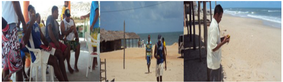
Figura 7- Inserindo as coordenadas no GPS e logo em seguida procurando a direção pela bússola, observando o rumo, à distância e as estratégias.

As direções no mar são diferentes das direções em terra. Com experiência de quem se desloca no mar um dos pescadores representou o que é chamado por eles de processo de triangulação (Fig. 8), para que pudéssemos realizar a tarefa da forma mais real possível.