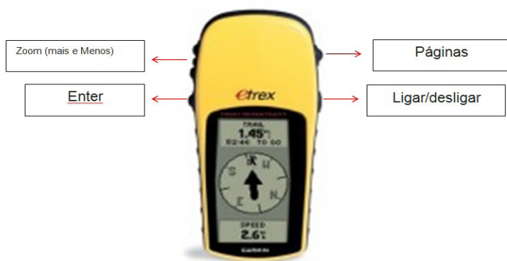
Figura 3- Modelo de GPS utilizado durante a oficina, este GPS Garmin tem todos os menus em português, arquivos detrilhas automáticas, é possível salvar até 10 trilhas, computador de viagem, tela LCD, corpo a prova d’água, autonomia de 22 horas com duas pilhas alcalinas.

Daí a necessidade de fazer escolhas constantemente em plena interação com os pescadores. Para os que não sabiam ler inicialmente foi ensinado a manusear o aparelho de GPS, partindo da colocação das pilhas, da observação da quantidade de botões e funções respectivas, houve também a necessidade de passar alguns códigos (lado direito botão das páginas e o de ligar/desligar, do lado esquerdo existem três botões o de zoom mais e zoom menos e o botão de Enter, este será o mais utilizado).