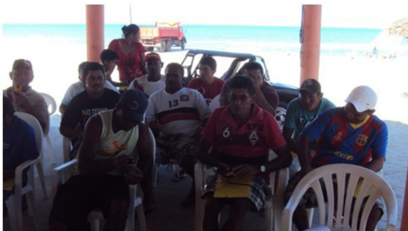
Figura 2- Oficina de GPS para pescadores da comunidade do Batoque – CE.

Apesar do planejamento realizado, durante a oficina de GPS foi necessário adaptar algumas estratégias e esquemas cognitivos simbólicos em função dos condicionantes estabelecidos pelo grupo de pescadores: a) grau de dificuldade do assunto: b) processo de assimilação do conhecimento (capacidade cognitiva, motivação, compreensão da importância da utilização do aparelho de GPS para pesca artesanal), c) local de realização da atividade (uma barraca de praia) (Fig. 2). Foi fundamental trabalhar questões específicas para a pesca: aprender a marcar a localização/posição, inserir uma posição no GPS, direção dos ventos, distância em metros, quilômetros, rumo, grau, bússola e criação de rotas.