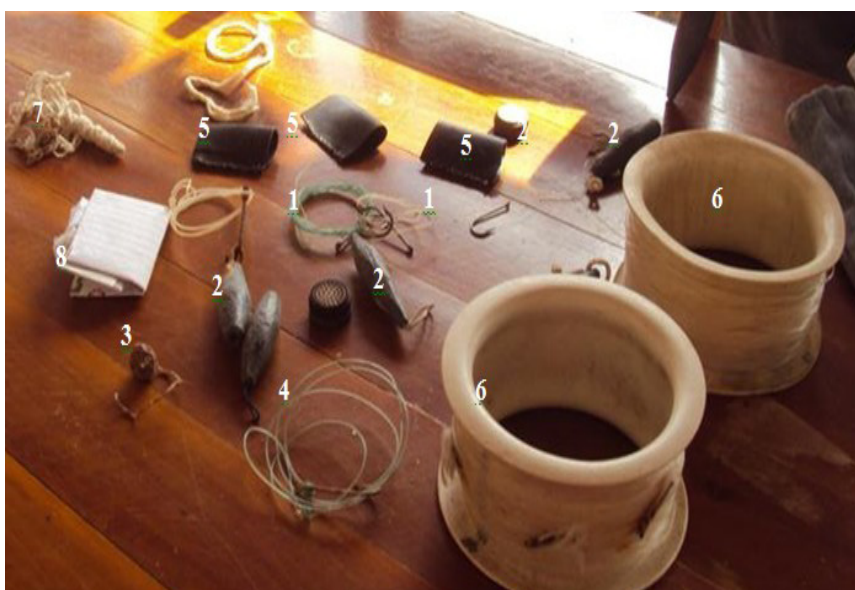
Figura 1- Instrumentos utilizados na pesca artesanal.