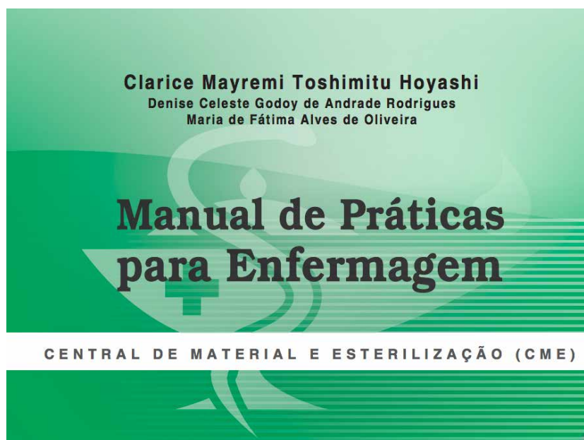
Figura 2 - Capa do Manual

Procurou-se neste manual ofertar não só as bases para a formação dos alunos, mas um instrumento didático útil e atualizado para todos os profissionais. O manual apresenta inicialmente, nos dois primeiros capítulos, a finalidade e os objetivos de uma CME, localizando não só a área física necessária para a realização de um trabalho com qualidade, como também situando os profissionais de enfermagem nesse contexto.