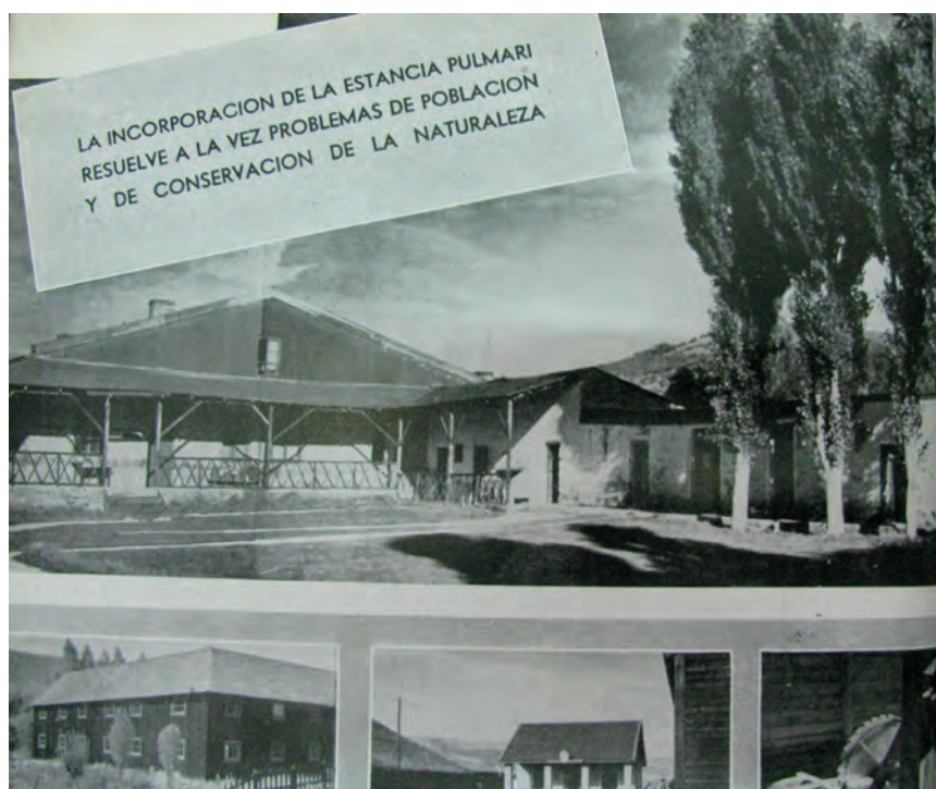
Imagen 1. Memorias de Parques Nacionales. La incorporación del Anexo Pulmarí. (APN, 1949: s/n).

16. APN. Memoria General 1948 (1949: 9 y ss).