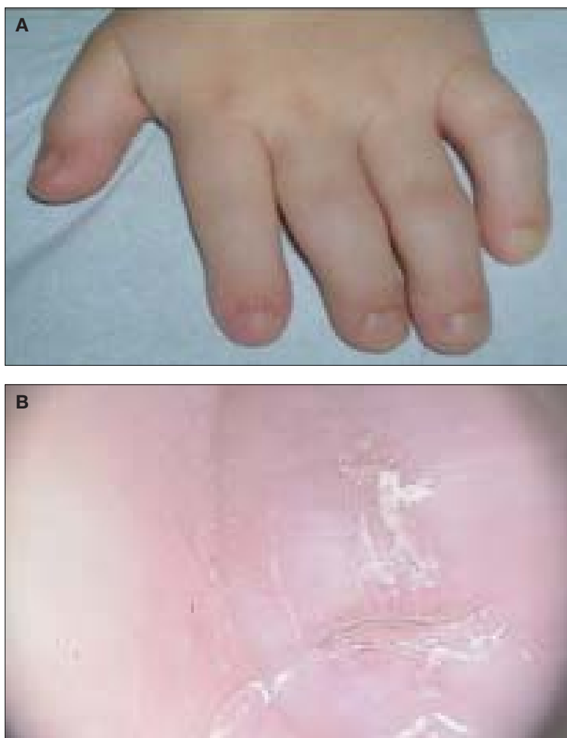
Rycina 3. Objaw onychodysplazji: A – dystroficzne paznokcie, B – paznokcie typu szkiełka od zegarka

Czwarty objaw dysplazji ektodermalnej według Freire-Maia i Pinheiro to dyshydrosis. Skóra u pacjentów z defektem ektodermalnym jest cienka, gładka, blada z powodu zmniejszonej ilości pigmentu, z miejscową brązową hiperpigmentacją w okolicy powiek, kolan i łokci (w postaci hipohydrotycznej). Niedobór i hipoplazja gruczołów łojowych powoduje szorstkość i nadmierne rogowacenie dłoni i stóp. Zmniejszona liczba i niewydolność gruczołów potowych sprawiają, że jest ona sucha i ciepła. Występują zaburzenia termoregulacji (zwłaszcza u niemowląt) i nadwrażliwość na temperaturę. Opisywane są przewlekłe wykwity egzematyczne, złuszczające zapalenie skóry, keratodermia i rybia łuska. U pacjentów z dysplazją ektodermalną stwierdza się charak-