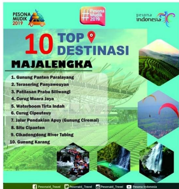
Gambar 1.4 10 Top Destinasi Wisata Majalengka

dan sudah memiliki pengunjung alami yang lumayan, pilihan tempat-tempat wisata yang akan dilokuskan oleh Dinas Pariwisata dan Kebudayaan Majalengka pun kian mengerucut dengan menggunakan teknik skoring terdapat 10 top destinasi wisata di Kabupaten Majalengka hingga akhirnya pilihan sampai di dua destinasi wisata yang akan dilokuskan pengembangannya yaitu Kawasan Wisata Gunung Panten Paralayang dan Terasering Panyaweuyan. 10 Top destinasi seperti dalam gambar: