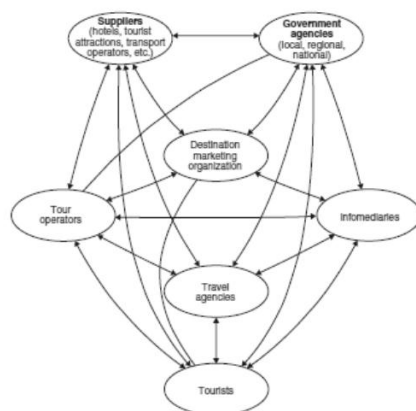
Gambar 1.3 Keterkaitan Semua Pihak dalam Implementasi Brand Sumber: (Situmorang, 2008)

Morgan dan Pritchard (Amaliah, 2013) mengatakan Brand implementations yaitu suatu upaya untuk mengintegrasikan semua pihak yang ikut terlibat dalam pembentukan merek sehingga destination branding dapat berhasil. Seperti dalam gambar berikut: