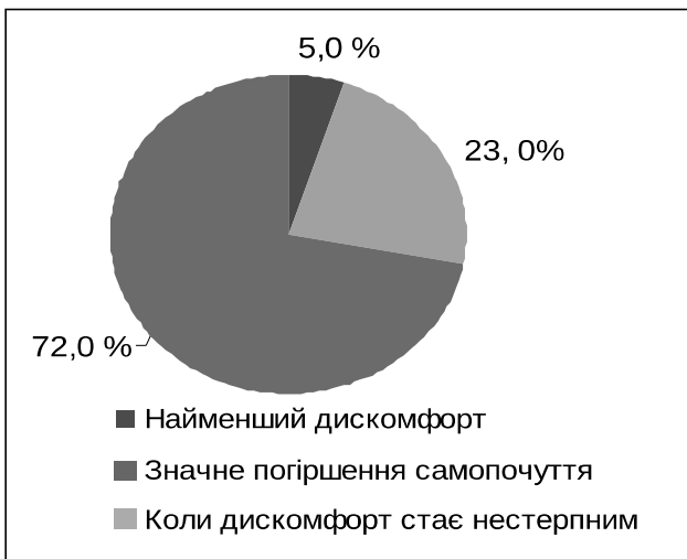
Рис. 3. Структура звернень до лікаря при погіршенні самопочуття.

Більшість студентів ( 72,0 \pm 4,5 ) % звертається до лікарів при значному погіршенні самопочуття, ( 23,0 \pm 4,2 ) % – коли дискомфорт стає нестерпним, ( 5,0 \pm 2,1 ) % – при найменшому дискомфорті, що призводить до виявлення захворювань на пізніх стадіях розвитку (рис. 3). Тільки ( 42,0 \pm 4,9 ) % іногородніх студентів звертаються у лікувально-профілактичні заклади з метою профілактики, що унеможливорює ефективне попередження хвороб в основній частині молоді.