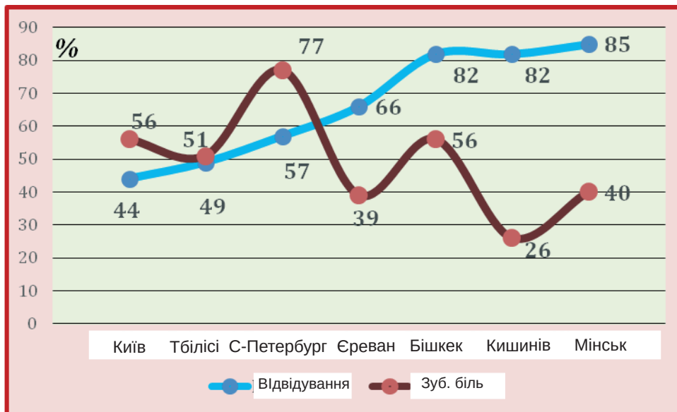
Рис. 2. Частка 15-річних школярів (%), які відвідали лікаря-стоматолога (за викликом або самостійно), і випадки зубного болю протягом останніх 12 місяців

вані і Санкт-Петербурзі не узгоджуються з даними стоматологічного статусу цих дітей (див. табл. 1). Але пропорція дітей, що мають проблеми в спілкуванні, досить переконливо відповідає індикатору «самооцінка». Таким чином, не тільки об'єктивні, але й суб'єктивні індикатори можуть вказувати на стан стоматологічного здоров'я дітей шкільного віку та важливі критерії якості життя та, відповідно, можуть бути використані для вдосконалення системи лікувально-профілактичної стоматологічної допомоги дитячому населенню країни.