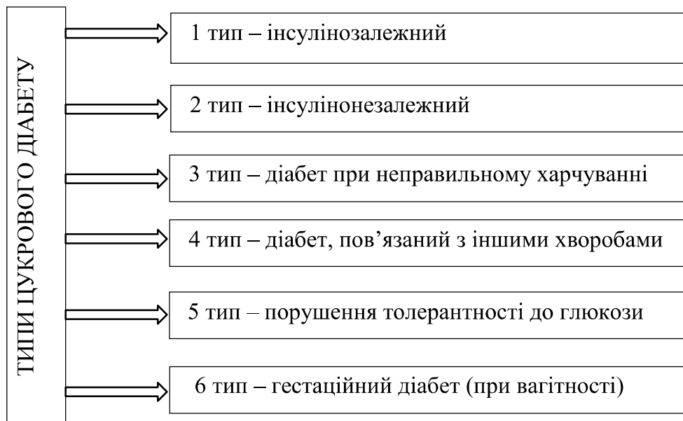
Рис. 1. Типи цукрового діабету.

Інсулінонезалежний цукровий діабет (2 тип) спостерігають майже у 90–95 % хворих, його діагностують у дорослих старше 40 років. Підшлункова залоза виробляє достатню кількість інсуліну, але клітини організму не реагують належним чином, оскільки вони є резистентними до інсуліну. Цей тип цукрового діабету виникає поступово, часто його діагностують випадково при періодичному обстеженні чи стає «знахідкою» при перебуванні пацієнта на стаціонарному лікуванні з будь-яким іншим захворюванням.