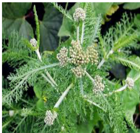
Рис. 3. Achillea diatans Wald. на дослідних ділянках.