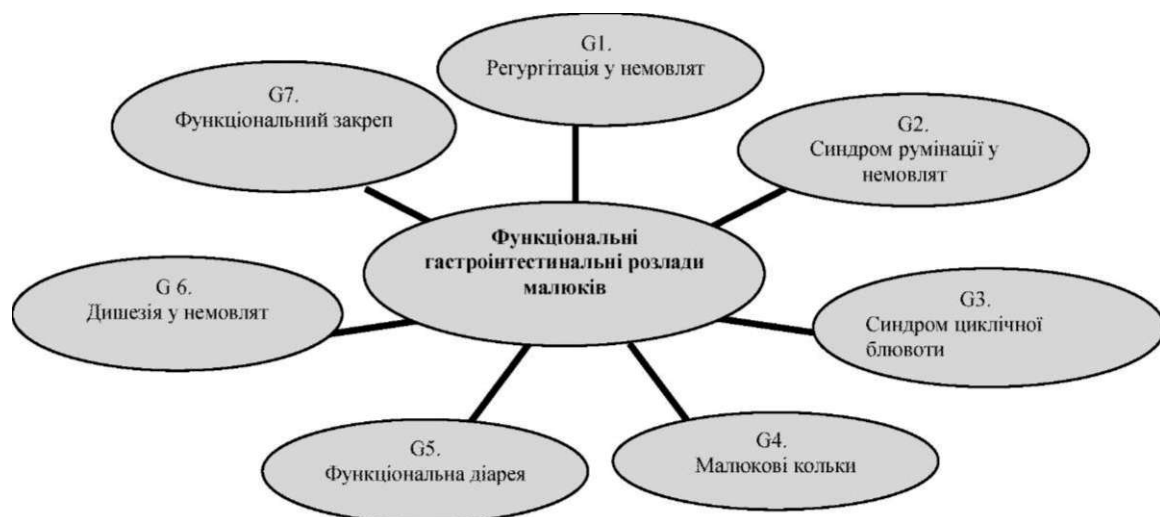
Рис. 1. Функціональні гастроінтестинальні розлади у дітей раннього віку.

Згідно з Римськими критеріями III (2006), виділяють наступні функціональні гастроінтестинальні розлади у новонароджених і дітей раннього віку (рис. 1):