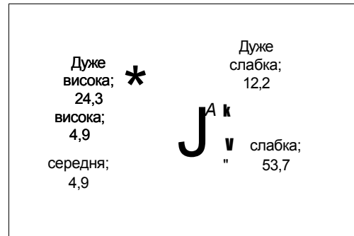
Рис. 2. Структура ступеня ніотинової залежності серед активних курців (у %)

ВИСНОВКИ. Таким чином, проведене дослідження свідчить про те, що на сьогодні існує серйозна проблема оцінки поширеності тютюнокуріння серед учнів-підлітків. Навіть анонімне анкетування не дає достовірних результатів, оскільки більшість підлітків приховує факт активного тютюнокуріння. З цією метою для об'єктивної оцінки поширеності тютюнокуріння серед учнів-підлітків рекомендовано використо-