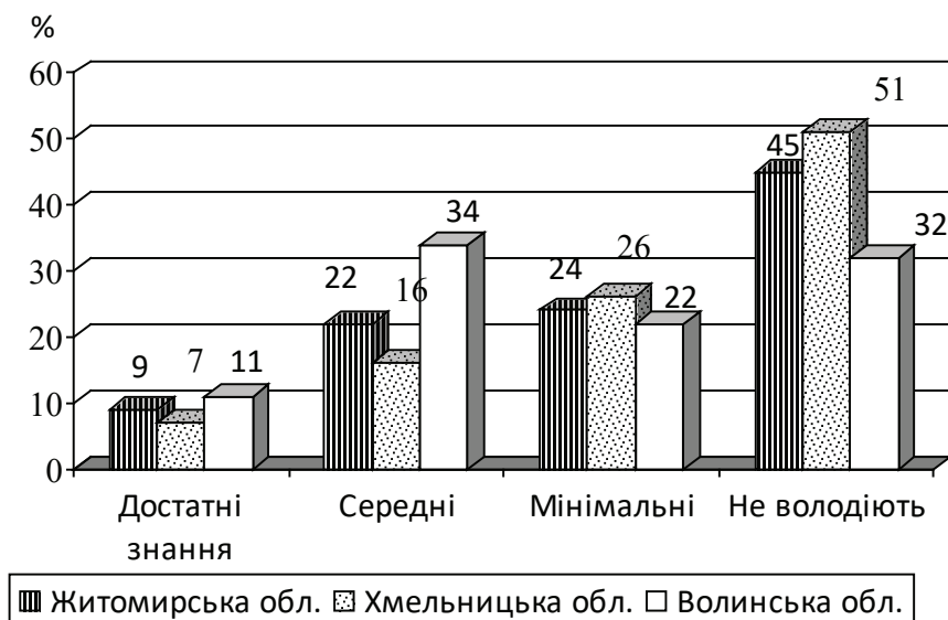
Мал. 1. Власна поінформованість про хворобу Лайма працівників лісу Житомирської, Хмельницької та Волинської областей.

Іспанії – 9,3 %, Норвегії – 16 % [10]. За нашими даними, частота серопозитивності щодо комплексу B. burgdorferi sensu lato серед зазначених працівників у Тернопільській області склала 43,3 % [11].